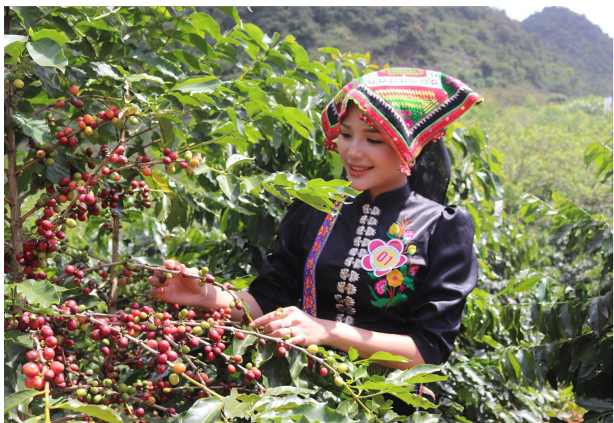
Cà phê cho năng suất cao tại xã Chiềng Cọ, thành phố Sơn La

Sơn La miền đất xanh huyền thoại được mệnh danh là mái nhà của Tây Bắc, xứ sở hoa ban trắng với núi non hùng vĩ; nơi sinh sống của cộng đồng 12 dân tộc anh em. Theo thời gian, chính quyền và nhân dân trong tỉnh đã dựa trên thế mạnh về cảnh quan địa lý, khí hậu, môi trường, bản sắc văn hóa của các dân tộc địa phương để bút phá mở ra những con đường mới trên mảnh đất này.