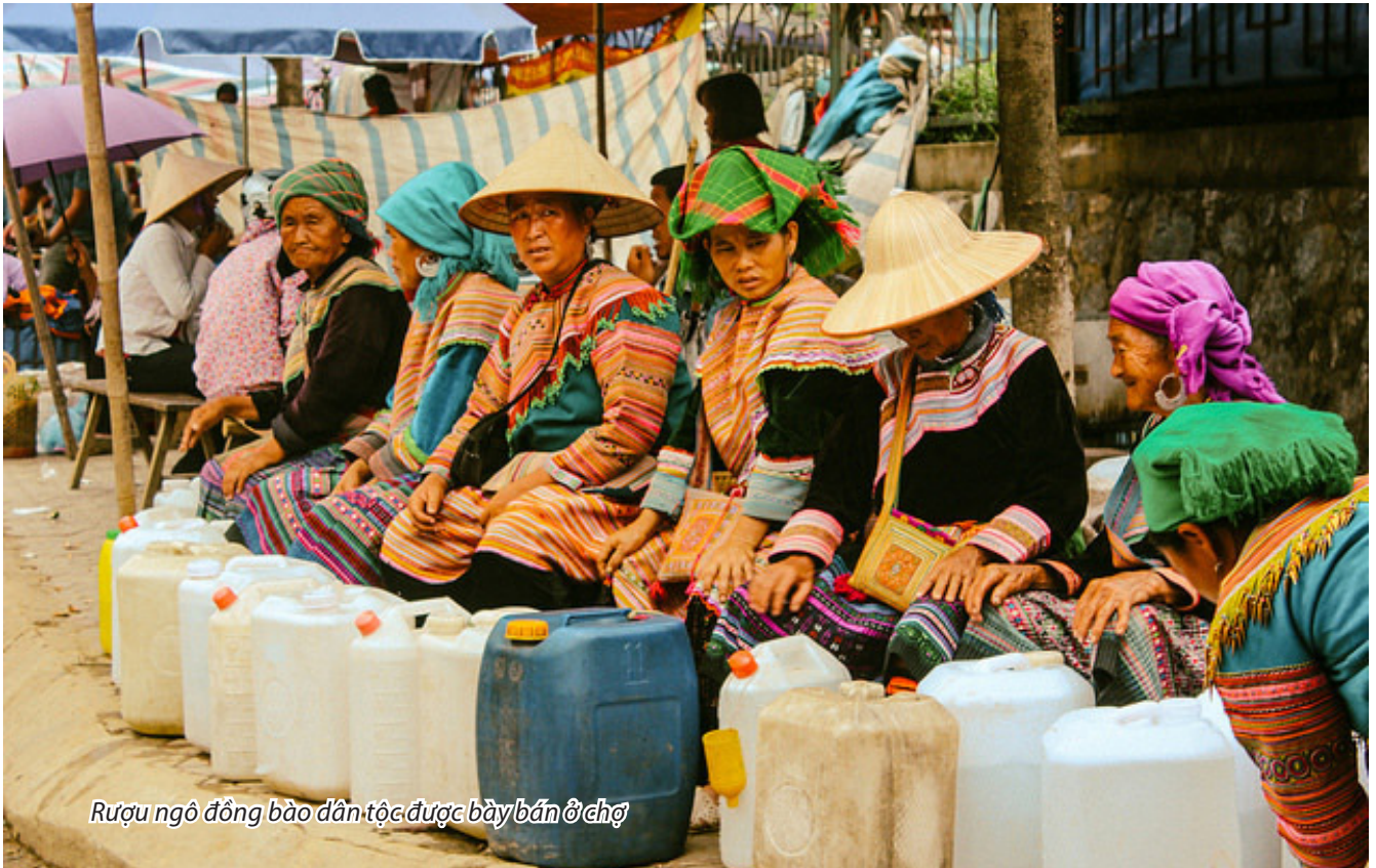
Rượu ngô đồng bào dân tộc được bày bán ở chợ

N gay sát thị trấn Bắc Hà, đi theo những con đường nhỏ quanh co, uốn lượn ven sườn núi, nhìn xuống phía dưới bắt gặp thung lũng xanh mướt một màu của ngô, lúa non và mận Tam hoa. Đó chính là xã Bản Phố. Ấn tượng đầu tiên là những bản làng nằm cheo leo trên sườn núi với những ngôi nhà trình tường, đỏ vàng màu đất.