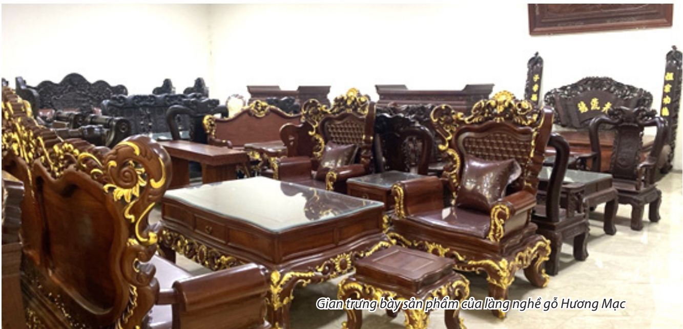
Giàn trưng bày sản phẩm của làng nghề gỗ Hương Mạc

Hy vọng với “tấm áo mới” - được bảo hộ nhãn hiệu tập thể, cùng với sự quan tâm của Đảng và Nhà nước, thời gian tới làng nghề truyền thống sản xuất đồ gỗ mỹ nghệ Hương Mạc sẽ tiếp tục phát triển hơn nữa, đóng góp nhiều hơn nữa vào phát triển kinh tế - xã hội của địa phương.