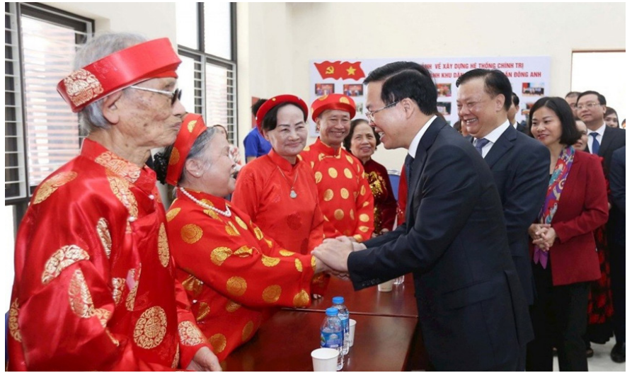
Chủ tịch nước Võ Văn Thưởng chúc Tết người cao tuổi Tổ dân phố 2, 3, 4 thị trấn Đông Anh.

Tiếp đó, Chủ tịch nước đã đến thăm, tặng quà, chúc Tết Trường Mầm non Phúc Lộc (xã Uy Nỗ), Tổ dân phố 2, 3, 4 thị trấn Đông Anh và trò chuyện với học sinh Trường THCS Nguyễn Huy Tưởng.