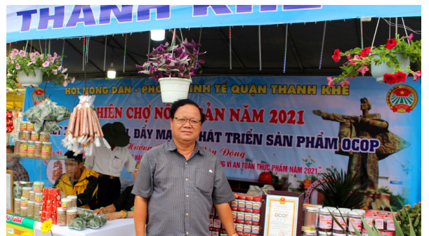
Gian hàng bày các sản phẩm đạt OCOP của quận Thanh Khê, TP. Đà Nẵng tại Hội chợ.