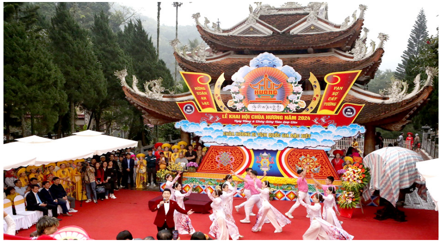
Một số hình ảnh tại Lễ hội Chùa Hương 2024.

Sáng 15/02/2024 (tức mồng 6 tháng Giêng xuân Giáp Thìn), tại sân Thiên Trù - Chùa Hương, UBND huyện Mỹ Đức (Hà Nội) long trọng tổ chức Lễ khai hội Chùa Hương năm 2024 với chủ đề: Lễ hội Chùa Hương “An toàn, Văn minh, Thân thiện”. Lễ hội được tổ chức với quy mô cấp huyện và kéo dài 3 tháng, từ 11/02/2024 đến hết ngày 01/5/2024.