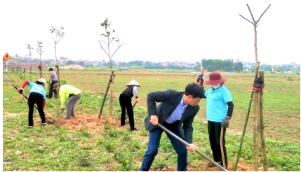
Lãnh đạo xã Tân Hồng và đại diện các ngành đoàn thể tham gia Tết trồng cây.