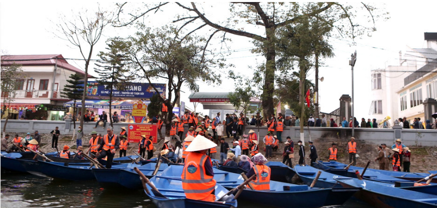
Từ sáng sớm, các chủ thuyền đò được đánh số thứ tự, xếp hàng, mặc áo phao chờ đón khách từ Bến Đục vào trong Thiên Trù.

Ban tổ chức Lễ hội cũng khuyến cáo tới du khách về thăm quan thắng cảnh, lễ phật đầy năm cần chủ động trong việc chung tay giữ gìn vệ sinh môi trường, ứng xử văn minh, lịch sử, không chơi bài ăn tiền trên thuyền, không vứt rác thải bừa bãi,... Tuần tra, kiểm tra và xử lý toàn bộ xuống máy, xuống điện, đò chở khách vi phạm các quy định. Xử lý nghiêm các trường hợp cố tình bán hàng rong trên dòng suối Yến.