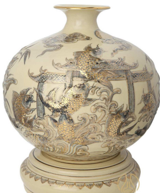
Bình Giọt ngọc "Cá chép vượt vũ môn" phiên bản đắp nổi vẽ vàng kim cao cấp

Ở một phiên bản khác, bình Giọt ngọc "Cá chép vượt vũ môn - Cửu ngư quần hội" được kết hợp thêm lớp vàng kim, tạo ra một sản phẩm mang ý nghĩa phong thủy sâu sắc, hội tụ đủ âm dương ngũ hành (Kim - Mộc - Thủy - Hỏa - Thổ).