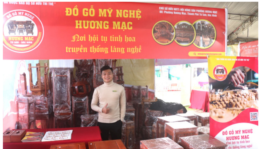
Gian trưng bày sản phẩm của làng nghề gỗ Hương Mạc (Tại Hội chợ Công thương và sản phẩm OCOP Bắc Ninh – 2023)

Họ đã để lại cho đời sau những công trình văn hóa như đình làng Hương Mạc có từ thời Lê, xây dựng lại vào thời Nguyễn và đến tận bây giờ nó trở thành một công trình kiến trúc khang trang bề thế. Rồi một số nhà thờ của các bậc đại khoa đã được cấp bằng di tích lịch sử văn hóa như: đền thờ cụ Tiết nghĩa Đàm Thận Huy, đền thờ Trạng nguyên Nguyễn Giản Thanh, đền thờ Quốc sư Đàm Công Hiệu, đền thờ Quận công Đàm Đình Cư, đền thờ cụ Hoàng giáp Đỗ Đại Uyên... Nghề chạm khảm của làng Mạc từ ấy đã được nhân rộng, nhiều người biết đến và được đánh giá cao.