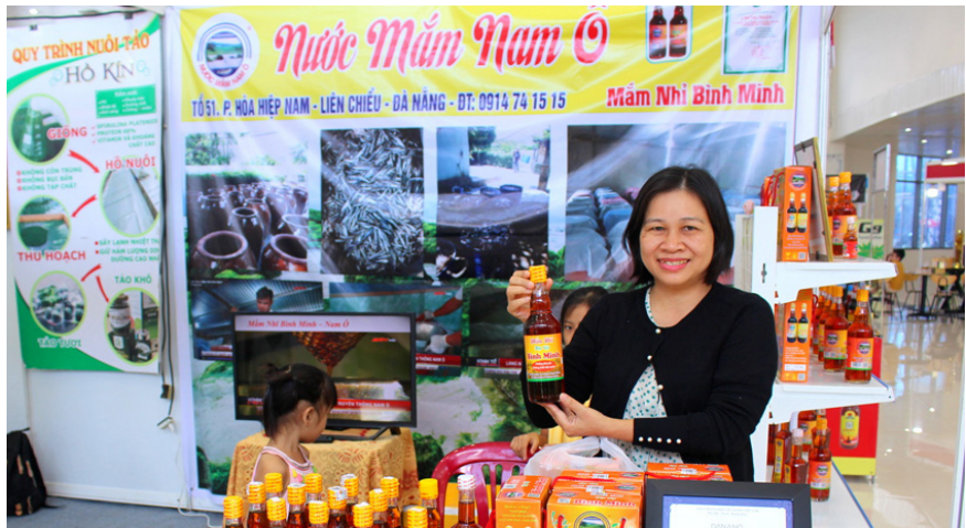
Nước mắm nhĩ Bình Minh của HTX Mắm Bình Minh (phường Hòa Hiệp Nam, quận Liên Chiểu) đạt OCOP 4 sao.

Những năm qua, UBND thành phố Đà Nẵng đã ban hành kế hoạch triển khai thực hiện chương trình “Mỗi xã một sản phẩm” (OCOP) nhằm phát triển sản phẩm OCOP tại Đà Nẵng đưa OCOP trở thành sản phẩm chủ lực, có uy tín, chất lượng và cạnh tranh trên thị trường trong và ngoài thành phố.