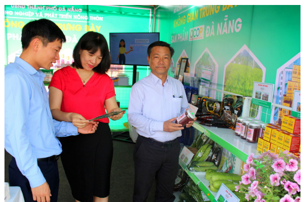
Các sản phẩm đạt OCOP 3-4 sao trưng bày tại Hội chợ Nông nghiệp huyện Hòa Vang