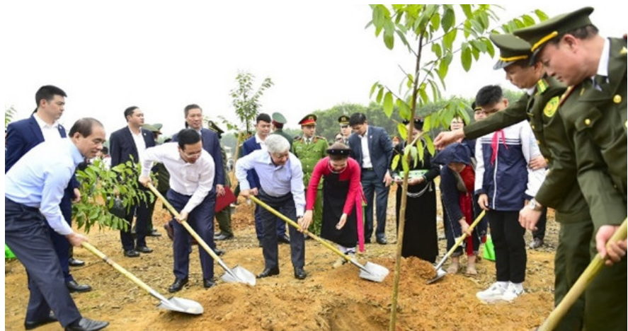
Sau lễ phát động Tết trồng cây, Chủ tịch nước Võ Văn Thưởng và các đại biểu đã tham gia trồng 2ha rừng tại xã Kim Phú, thành phố Tuyên Quang.

phòng, chống tội phạm, nhất là tội phạm ma túy, đánh bạc và các tệ nạn xã hội khác trong dịp lễ hội mùa xuân; thực hiện tốt chế độ, chính sách an sinh xã hội; chú trọng chăm lo đời sống một bộ phận công nhân mất việc làm gặp khó khăn, cũng như rà soát, giải quyết dứt điểm các vụ việc phức tạp, mâu thuẫn về quyền lợi của công nhân, người lao động, không để kéo dài trở thành "điểm nóng" về an ninh, trật tự. Tăng cường cảnh giác, bảo vệ an ninh chính trị nội bộ... tăng cường công tác thông tin, tuyên truyền, nâng cao chất lượng nội dung các chương trình văn hóa, thông tin định hướng, khẳng định thành tựu phát triển kinh tế, văn hóa - xã hội của đất nước, địa phương cũng như đấu tranh hiệu quả với những luận điệu sai trái, xuyên tạc, sai sự thật của các thế lực thù địch.