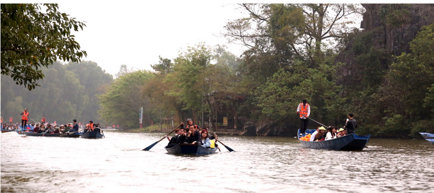
Dòng người trên thuyền Suối Yến hành hương, ngắm cảnh, lễ phật tại Lễ hội Chùa Hương.

Điểm nổi bật của Lễ hội Chùa Hương năm 2024 là Ban Tổ chức tiếp tục tập trung đổi mới công tác tổ chức lễ hội đảm bảo an toàn, văn minh và thân thiện. Chính trang cảnh quan, không gian lắp đặt panô, backdrop, bồn hoa cây cảnh dọc tuyến đường Tỉnh lộ 419 (từ Đốc Tín đi Hương Sơn) và tuyến đi bộ hai bên bờ suối Yến để tạo cảnh quan cho du khách về tham quan thưởng ngoạn lễ hội. Việc