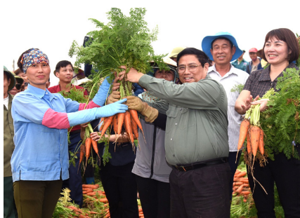
Thủ tướng Phạm Minh Chính thu hoạch cà rốt cùng nông dân xã Đức Chính, huyện Cẩm Giàng.

Thủ tướng Chính phủ Phạm Minh Chính đã trực tiếp ngồi máy cấy để điều khiển cấy lúa trên cánh đồng, thu hoạch cà rốt cùng nông dân trên cánh đồng ở Hải Dương.