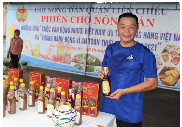
Nước mắm Hương Làng Cổ đạt OCOP 4 sao.