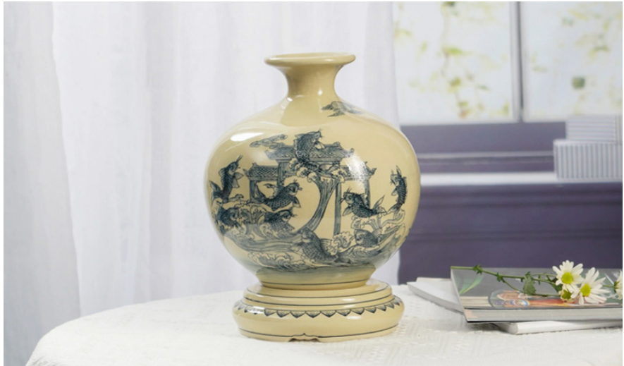
Bình Giọt ngọc họa tiết Cá chép vượt vũ môn truyền thống

Sản phẩm được những người thợ lành nghề của Chu Đậu chế tác thủ công 100% dưới lớp men được chiết xuất từ tro trấu – loại men