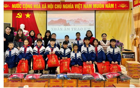
Các cháu học sinh Trường Tiểu học Quảng Uyên, thị trấn Quảng Uyên, huyện Quảng Hòa, tỉnh Cao Bằng nhận quà.

T hời tiết khắc nghiệt như hiện nay và nhiều khó khăn về kinh tế, hoàn cảnh gia đình, bệnh tật... là sự trở ngại đối với các em học sinh trong việc học tập tìm tới nguồn tri thức nhằm thay đổi cuộc sống.