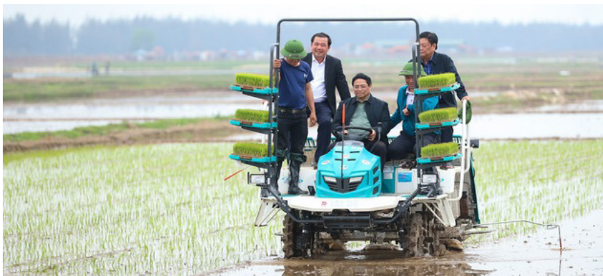
Thủ tướng Chính phủ Phạm Minh Chính trực tiếp ngồi máy cấy để điều khiển cấy lúa trên cánh đồng

Sau khi nghe báo cáo về tình hình sản xuất lúa vụ Đông Xuân 2024 và việc ứng dụng cơ giới hóa trong gieo cấy lúa, mô hình ứng dụng nông nghiệp công nghệ cao trong sản xuất lúa (cánh đồng