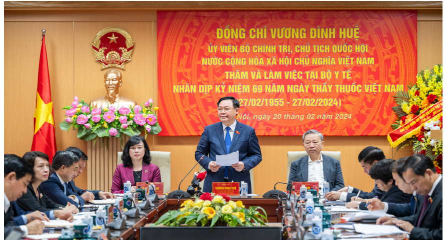
Chủ tịch Quốc hội Vương Đình Huệ cùng Đoàn công tác đã đến thăm và làm việc tại Bộ Y tế nhân dịp kỷ niệm 69 năm Ngày Thầy thuốc Việt Nam (27/02/1955 – 27/02/2024)

Công tác xây dựng thể chế tiếp tục được chú trọng và tập trung hoàn thiện. Từng bước tháo gỡ các tồn tại, bất cập đã được bộc lộ thời gian qua như cơ chế mượn trang thiết bị, vật tư y tế, thuốc và cơ chế vay vốn đầu tư đối với bệnh viện công lập; các quy định đối với người hành nghề và đối với người bệnh. Dịch Covid-19 và các dịch bệnh truyền nhiễm khác được kiểm soát tốt, bảo đảm công tác tiêm chủng vắc xin phòng bệnh. Chất lượng, hiệu quả công tác khám bệnh, chữa