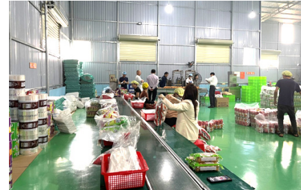
Máy đóng gói sản phẩm

Máy móc thiết bị mới đưa vào hoạt động đã giúp doanh nghiệp khép kín quy trình sản xuất, nâng cao năng lực hoạt động theo quy mô công nghiệp, tạo ra sản phẩm bánh mì tươi đảm bảo chất lượng,