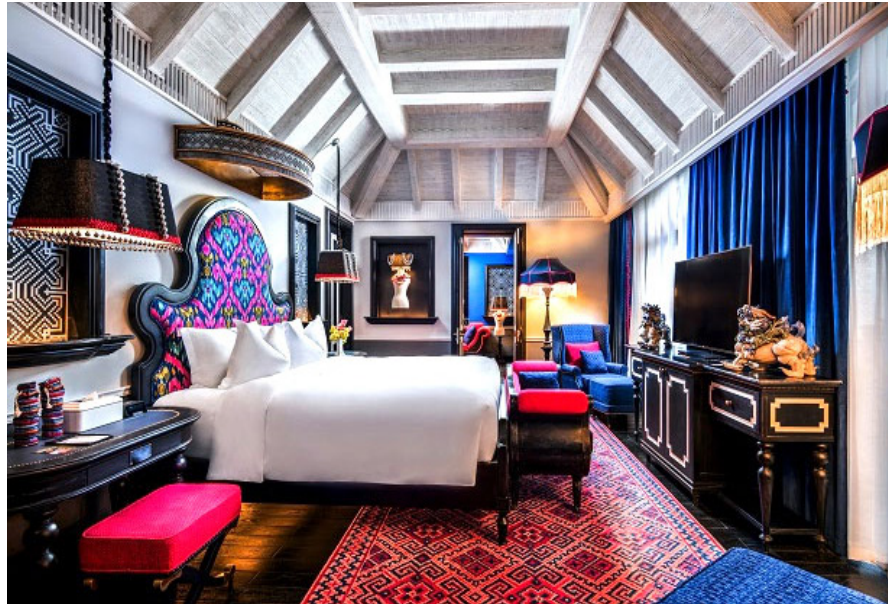
Phong cách hiện đại ở khách sạn 5 sao quốc tế Hotel de la Coupole – MGallery tại Pa. Các họa tiết và hoa văn trên các loại vải được sử dụng khéo léo nhằm tôn vinh văn hóa bản địa của người H'Mong.