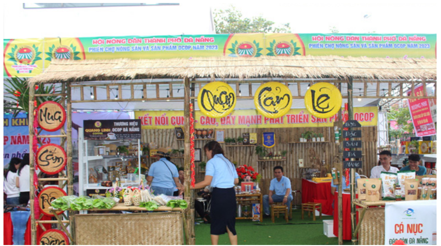
Gian hàng trưng bày của Hội Nông dân quận Cẩm Lệ.