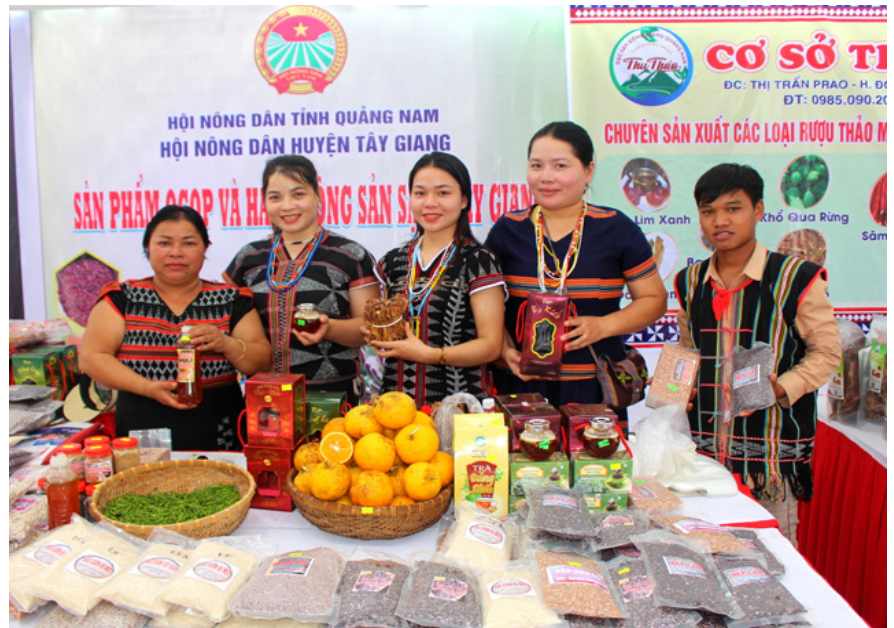
Các "sơn nữ" Cơ Tu (Tây Giang) giới thiệu sản phẩm của đơn vị mình.

toàn thực phẩm cho hội viên nông dân, đồng thời đề cao vai trò và trách nhiệm của họ trong các hoạt động sản xuất, chế biến, bảo quản, tiêu dùng các sản phẩm nhằm bảo vệ sức khỏe cộng đồng.