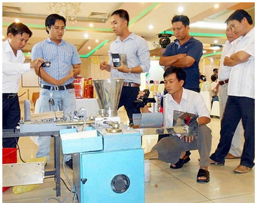
Trung tâm Khuyến công và Tư vấn phát triển công nghiệp triển khai nhiều đề án hỗ trợ ứng dụng máy móc vào sản xuất chế biến

Hoạt động khuyến công trên địa bàn tỉnh không những giúp các cơ sở CNNT phát triển sản xuất, phát triển sản phẩm, mở rộng thị trường mà còn đồng hành, tiếp sức các cơ sở CNNT vượt qua khó khăn sau đại dịch Covid-19, cạnh tranh chiến lược giữa các nền kinh tế lớn, xung đột vũ trang... góp phần thực hiện thành công Chương trình phục hồi và phát triển kinh tế - xã hội theo Nghị quyết số 11/NQ-CP ngày 30/01/2022 của Chính phủ.