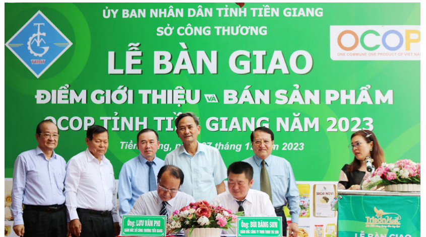
Lễ ký kết biên bản bàn giao Điểm giới thiệu và bán sản phẩm OCOP tỉnh Tiền Giang và cam kết triển khai thực hiện đến năm 2025 giữa Sở Công thương (bên giao) và Công ty TNHH TM DV Trí Sơn (bên nhận).