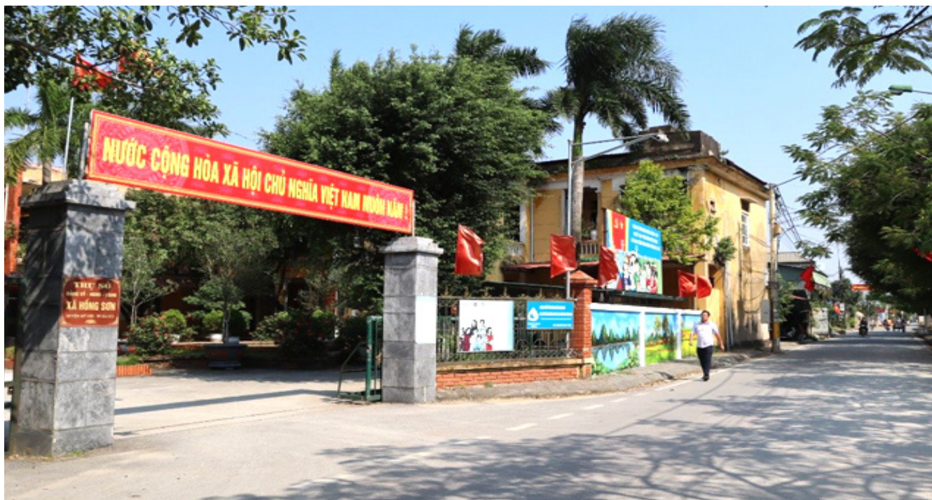
Một góc Nông thôn mới xã Hồng Sơn, huyện Mỹ Đức, Thành phố Hà Nội

Vol. 20 sản phẩm đạt 4 sao đó là: Nấm Kim châm KINOKO, Gối bông tơ tằm tự dệt, Chăn bông tơ tằm tự dệt; Bộ Khăn bông cotton BOHA, Bộ Khăn bông sợi Tre BOHA, Bộ Khăn bông sợi Nở BOHA, Áo choàng tắm BOHA, Khăn bông tơ tằm, Tranh lụa tơ sen - Tác phẩm báu vật Quốc hoa, khẩu trang tơ tằm, Tranh lụa tơ sen - Tác phẩm hoa sen Việt Nam, Khăn thô tơ tằm từ kén phế, Bộ khăn tơ tằm cao cấp 2 lớp trẻ em, Tranh Lụa tơ tằm, Khăn lau đa năng BOHA, Khăn lau ô tô chuyên dụng BOHA, Khăn tắm sợi tre MyDutex, Khăn mặt sợi tre MyDutex, Khăn tắm sợi cotton MyDutex, Khăn mặt sợi cotton MyDutex. 01 sản phẩm đạt 5 sao đó là Chăn bông tơ tằm tự dệt; 02 sản phẩm có tiềm năng 5 sao trình Trung ương thẩm định, công nhận đó là: Khăn Lụa Tơ Sen, Khăn lụa Tơ tằm. Huyện đã xây dựng được 01 điểm giới thiệu và bán sản phẩm OCOP của huyện tại công ty TNHH Dệt may Thành Long, xã Phùng Xá, huyện Mỹ Đức.