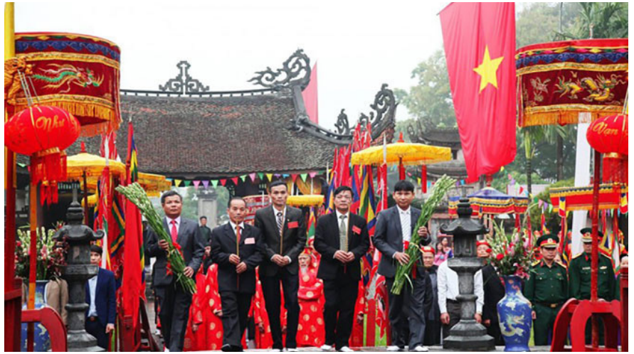
Hương ước làng có vai trò quan trọng trong xây dựng nông thôn mới ở xã Yên Sở, huyện Hoài Đức, Hà Nội.

Tại Hà Nội, những năm qua, việc tự giác chấp hành quy ước, hương ước của mỗi người dân ngày càng phát huy hiệu quả. Hương ước, quy ước đã có tác dụng duy trì lối ứng xử chuẩn mực trong cộng đồng làng, xã, giúp hạn chế, đẩy lùi những hủ tục, tập quán lạc hậu, gìn giữ và phát huy các giá trị tốt đẹp, xây dựng nếp sống văn minh, xây dựng gia đình hạnh phúc, phát triển các hoạt động văn hóa lành mạnh.