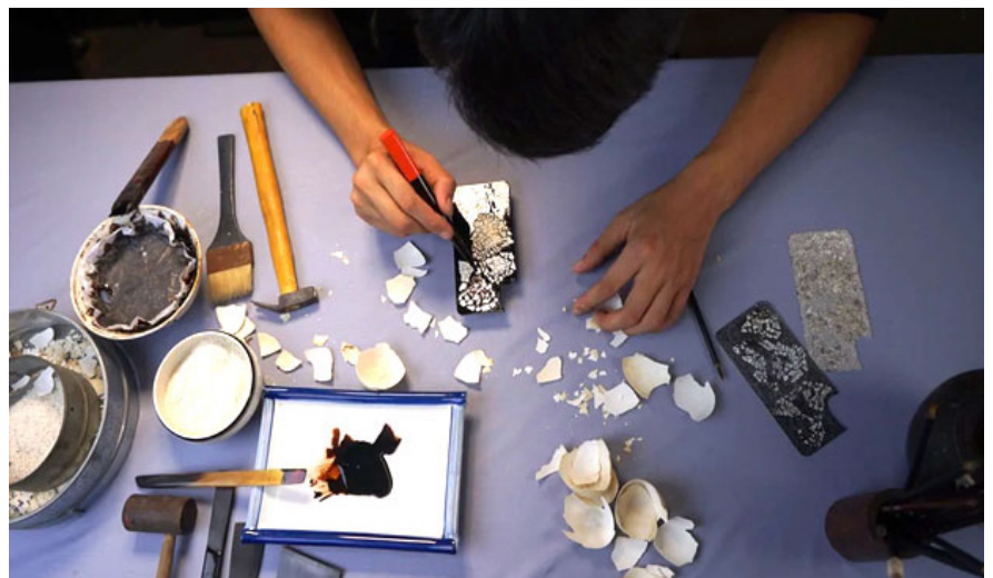
Nghệ nhân thực hiện kỹ thuật gắn vỏ trứng trong sản phẩm ốp điện thoại sơn mài.