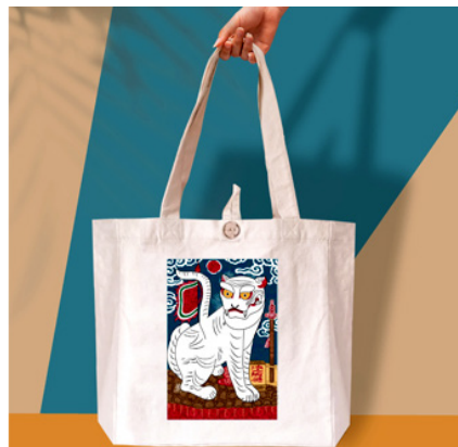
Các nghệ nhân kết hợp quai bằng mây, chiếc túi tote vải canvas in hình họa tiết dân tộc bằng những miếng lụa vụn tạo nên túi tote độc đáo.