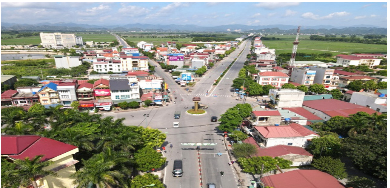
Diện mạo huyện Mỹ Đức hôm nay

OCOP. Trong đó có 17 sản phẩm đạt 3 sao, 20 sản phẩm đạt 4 sao, 01 sản phẩm 5 sao. 17 sản phẩm đạt 3 sao đó là: Bưởi Diễn Bột Xuyên, Khăn bông BOHA, Bộ Khăn bông cotton BOHA, Bộ Khăn bông sợi Nở BOHA, Bộ Khăn bông sợi Tre BOHA, Bánh Rau Sắng hiệu Chú béo, Rượu mơ Hương Tích, Bột Bò kết túi lọc, Bột tắm thảo dược cho bé, Bột thảo dược ngâm chân, Nước cốt phở bò, Nước cốt phở gà, Cốt lẩu thái Tomyum, Cốt lẩu nấm, Cốt bún bò Huế, Rượu nếp hạ thổ Đào Viên 30% Vol, Rượu nếp hạ thổ Đào Viên 35%