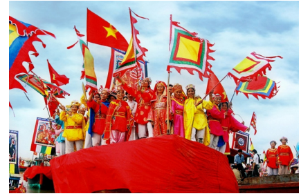
Lễ hội Võng La tại đình Đại Độ, làng Đại Độ, xã Võng La, huyện Đông Anh, Hà Nội

Bên cạnh đó, cần có quy định rõ mức kinh phí dành cho việc xây