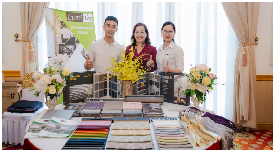
Lumitex - Chuyên thiết kế, thi công và lắp đặt rèm cửa cao cấp trọn gói toàn quốc!

Với phương châm: Khách hàng mới là người quyết định đến tương