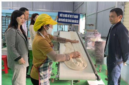
Kiểm tra chất lượng máy tạo hình bơm nhân

S au khi nghiên cứu tìm hiểu về chính sách khuyến công, Công ty đã lập hồ sơ đề nghị các cấp các ngành quan tâm xem xét, hỗ trợ cho doanh nghiệp thực hiện đầu tư ứng dụng máy móc thiết bị tiên tiến vào trong sản xuất bánh mì tươi và đề án đã được Chủ tịch UBND tỉnh phê duyệt