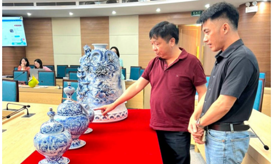
Văn phòng điều phối Chương trình xây dựng nông thôn mới thành phố Hà Nội đánh giá sản phẩm gốm Kim Lan năm 2023

Sau khi được “gắn sao” OCOP, các sản phẩm Gốm Kim Lan được quảng bá rộng rãi trên khắp các trang thông tin điện tử, các trang mạng xã hội. Nhờ đó, người tiêu dùng biết, tìm đến mua hàng nhiều hơn, lượng tiêu thụ tăng cao. Điều này không chỉ giúp người dân tăng thu nhập mà còn góp phần quảng bá văn hóa vùng miền, gìn giữ những giá trị nhân văn sâu sắc.