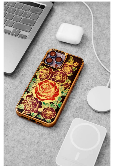
Đánh dấu bước chuyển mình giữa truyền thống và hiện đại, ốp điện thoại bằng sơn mài với phiên bản nâng cấp sạc được sạc không dây