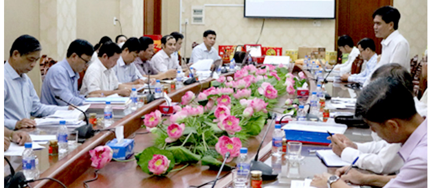
Hội đồng đánh giá, phân hạng sản phẩm OCOP cấp tỉnh Tiền Giang