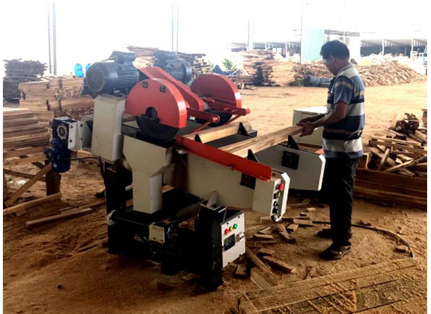
Hỗ trợ nguồn kinh phí khuyến công giúp doanh nghiệp đầu tư máy móc.

Năm 2022, tỉnh Bình Định đã tổ chức bình chọn sản phẩm CNNT tiêu biểu cấp tỉnh với 157 sản phẩm của 95 cơ sở CNNT tham gia. Đồng