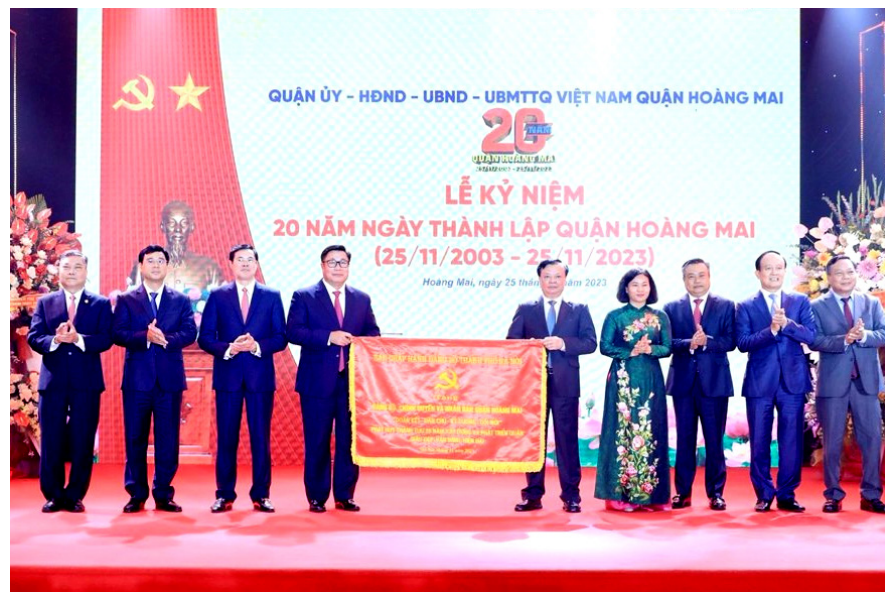
Bí thư Thành ủy Đinh Tiến Dũng trao tặng Đảng bộ, Chính quyền và Nhân dân quận Hoàng Mai bức trướng với dòng chữ: "Đoàn kết - Dân chủ - Kỷ cương - Đổi mới" phát huy thành tựu 20 năm xây dựng và phát triển Giàu đẹp - Văn minh - Hiện đại.

Sáng 25/11, Quận ủy, HĐND, UBND, Ủy ban Mặt trận Tổ quốc Việt Nam quận Hoàng Mai tổ chức trọng thể lễ kỷ niệm 20 năm Ngày thành lập quận (25/11/2003 - 25/11/2023). Đảng bộ, Chính quyền và nhân dân quận Hoàng Mai tiếp tục phát huy thành tựu 20 năm qua để xây dựng quận giàu đẹp, văn minh, hiện đại.