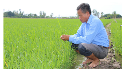
Tỉnh Đồng Tháp đẩy mạnh nghiên cứu, lai tạo thêm nhiều giống lúa mới năng suất, chất lượng nhưng vẫn đảm bảo thân thiện với môi trường và thích ứng biến đổi khí hậu

Từ đó, giúp phát huy vai trò của các hợp tác xã, hiệp hội ngành hàng trong liên kết, hỗ trợ sản xuất, bảo quản, chế biến, tiêu thụ thực phẩm an toàn, chất lượng. Khuyến khích, hỗ trợ hộ gia đình, hợp tác xã, doanh nghiệp sản xuất, kinh doanh thực phẩm ứng dụng công nghệ cao và kết nối chuỗi giá trị cung ứng thực phẩm an toàn. Nâng cao năng lực nghiên cứu, ứng dụng, chuyển giao khoa học, công nghệ, nhất là công nghệ cao, công nghệ sinh học, công nghệ thân thiện với môi trường trong sản xuất nông nghiệp và chế biến thực phẩm.