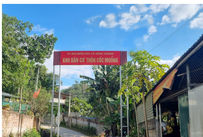
Đường vào khu dân cư thôn Cốc Muồng, xã Nông Thượng luôn sạch đẹp.