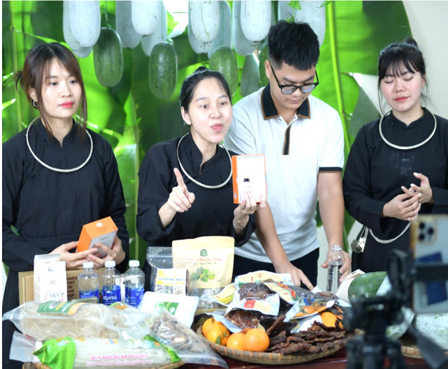
Sản phẩm OCOP Bắc Kạn được livestream thông qua các sàn thương mại điện tử như Tiktok.

Năm 2023, Bắc Kạn phấn đấu phát triển ít nhất 20 sản phẩm OCOP mới đạt 3 sao trở lên; Nâng cấp 04 sản phẩm từ 3 sao lên 4 sao, đề xuất 01 sản phẩm tham gia đánh giá sản phẩm OCOP cấp quốc gia. Cũng cố nâng cao chất lượng, mở rộng quy mô sản xuất sản phẩm OCOP đã được công nhận, tăng khả năng cạnh tranh trên thị trường (truy xuất nguồn gốc, liên kết chuỗi, phát triển thương hiệu, xúc tiến thương mại...)