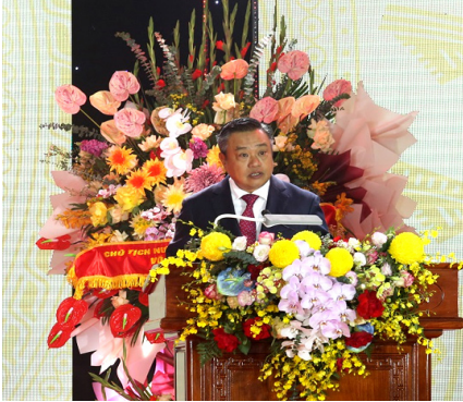
Ông Trần Sỹ Thanh - Ủy viên Ban Chấp hành Trung ương Đảng, Phó Bí thư Thành ủy, Chủ tịch UBND Thành phố Hà Nội phát biểu tại Lễ kỷ niệm.