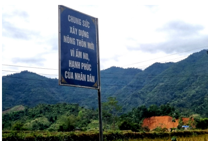
Tuyên truyền về chương trình xây dựng NTM luôn được UBND tỉnh Bắc Kạn triển khai về từng khu dân cư.

Qua quá trình thực hiện chương trình, xã Nông Thượng rút ra được nhiều bài học kinh nghiệm: Trước hết, phải làm tốt công tác tuyên