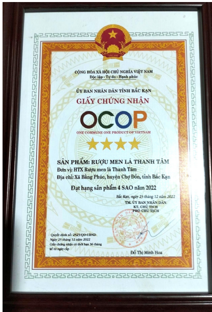
Rượu men lá Bằng Phúc – sản phẩm đạt OCOP 4 sao vào năm 2022 của HTX rượu men lá Thanh Tâm xã Bằng Phúc, huyện Chợ Đồn, tỉnh Bắc Kạn.

Còn tại HTX rượu men lá Thanh Tâm, bà Nông Thị Tâm – Giám đốc HTX cho biết, hiện nay HTX có 24 thành viên được thành lập từ 2017. Nhưng sản phẩm đã có những đơn hàng được xuất khẩu sang Nhật Bản vào tháng 10 năm 2022. Với số lượng xuất khẩu trung bình 1 tháng/ 4000 lít. Tuy nhiên Nhật Bản đang đặt vấn đề 1 tháng 10.000 lít. Sản phẩm đạt chứng nhận OCOP 4 sao tháng 12/2022.