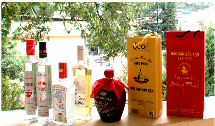
Một trong những sản phẩm OCOP huyện Chợ Đồn phục vụ khách du lịch.

Bắc Kạn đang nỗ lực phấn đấu hoàn thành mục tiêu: Đến năm 2025, xây dựng Khu du lịch Ba Bể trở thành khu du lịch Quốc gia, Khu du lịch hồ Nặm Cắt trở thành khu du lịch cấp tỉnh, mỗi huyện, thành phố có ít nhất 1 điểm, khu du lịch được công nhận; Đến năm 2030, ngành Du lịch Bắc Kạn cơ bản trở thành ngành kinh tế mũi nhọn của tỉnh theo tinh thần Nghị quyết số 18-NQ/TU ngày 12/8/2021 của Tỉnh ủy về phát triển du lịch giai đoạn 2021 – 2025, định hướng đến năm 2030.