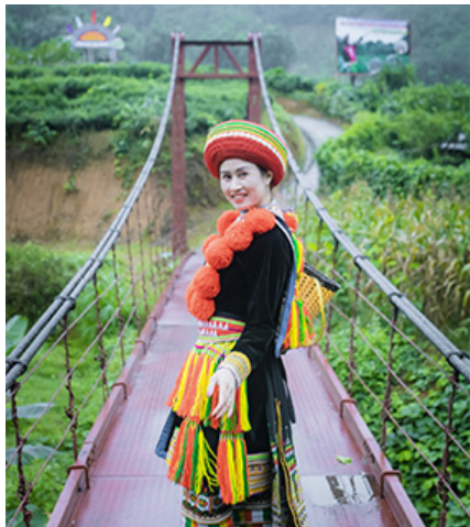
Cầu treo Phiêng An- điểm "check-in" đầu tiên của nhiều du khách khi đến tham quan.