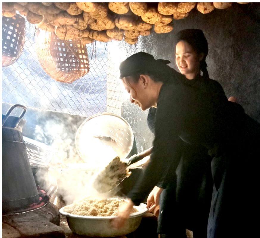
Người dân thôn Nà Pài, xã Bằng Phúc, huyện Chợ Đồn, tỉnh Bắc Kạn đang nấu rượu men lá từ quả men truyền thống của người Tày.

Trong không gian mờ sương tĩnh mịch, không khí lạnh phảng phất chút gió đầu mùa, se se lạnh. Khói bếp bốc lên nghi ngút len lỏi trong từng ngôi nhà thấp thoáng trên đồi núi cao. Người dân xã Bằng Phúc tất bật nấu những mẻ rượu đầu tiên, hương thơm lan tỏa khắp làng.