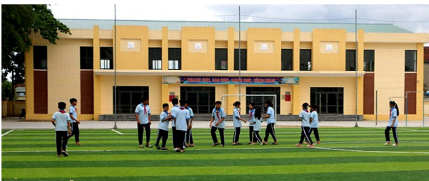
Sân thể dục và nhà đa năng hiện đại tại Trường THCS Bình Thịnh.

đường cứng hóa hoàn toàn. Nhà văn hóa thôn, trạm y tế xã, sân bóng chuyền, sân bóng đá, trường học... đều được đầu tư xây dựng khang trang.