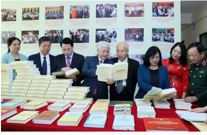
Các đồng chí Lãnh đạo Đảng, Nhà nước, đại diện các bộ, ban, ngành, đoàn thể tham quan khu trưng bày cuốn sách bên lễ buổi lễ ra mắt ngày 18/11.

tự đồng đạo các tầng lớp nhân dân. Trong bối cảnh tình hình thế giới diễn biến phức tạp, Đảng ta đang đẩy mạnh thực hiện các nhiệm vụ Nghị quyết Đại hội XIII của Đảng đã đề ra, đồng chí Tổng Bí thư khẳng định: Quy tụ, khơi dậy và phát huy sức mạnh đại đoàn kết toàn dân tộc chính là nhằm thực hiện thắng lợi mục tiêu “xây dựng đất nước Việt Nam hòa bình, độc lập, thống nhất, toàn vẹn lãnh thổ, ngày càng giàu mạnh, phồn vinh, văn minh, hạnh phúc, phấn đấu đến năm 2045, nước ta trở thành nước phát triển, có thu nhập cao làm điểm tương đồng, để động viên, cổ vũ mọi tầng lớp nhân dân, huy động mọi nguồn lực, tranh thủ mọi thời cơ, sự đóng góp của nhân dân để thực hiện thắng lợi nhiệm vụ xây dựng và bảo vệ Tổ quốc”.