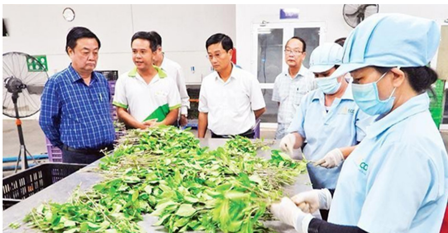
Ông Lê Minh Hoan - Bộ trưởng Bộ Nông nghiệp và Phát triển nông thôn khảo sát quá trình sản xuất rau sạch tại các trang trại rau sạch ở huyện Củ Chi, TP. HCM

Bộ NN&PTNT cũng yêu cầu các đơn vị chủ động, tích cực đẩy mạnh thông tin, truyền thông tuyên truyền về bảo đảm an ninh, ATTP trong lĩnh vực nông nghiệp; Cung cấp thông tin, dịch vụ tư vấn, hỗ trợ pháp luật về bảo đảm an ninh, ATTP nông, lâm, thủy sản; kịp thời thông