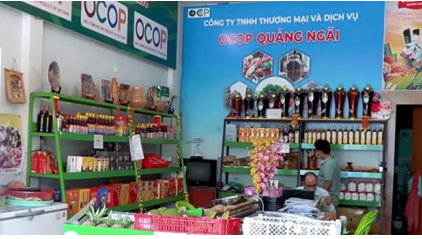
Tỉnh Quảng Ngãi đang nỗ lực xây dựng các sản phẩm OCOP

UBND tỉnh Quảng Ngãi vừa ban hành kế hoạch tổ chức Hội chợ triển lãm sản phẩm OCOP năm 2023. Theo kế hoạch, Hội chợ sẽ diễn ra từ ngày 14 - 20/12/2023.