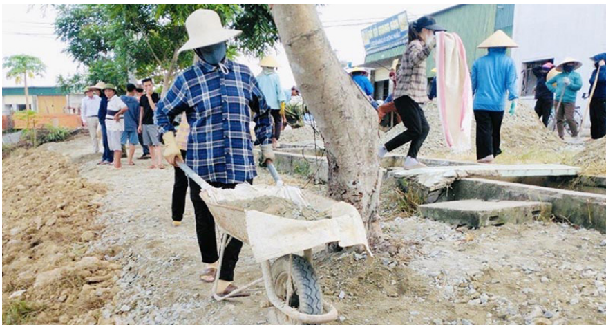
Sự đồng lòng, tích cực của nhân dân đã giúp xã Thanh Bình Thịnh đạt được nhiều kết quả tích cực trong xây dựng NTM.