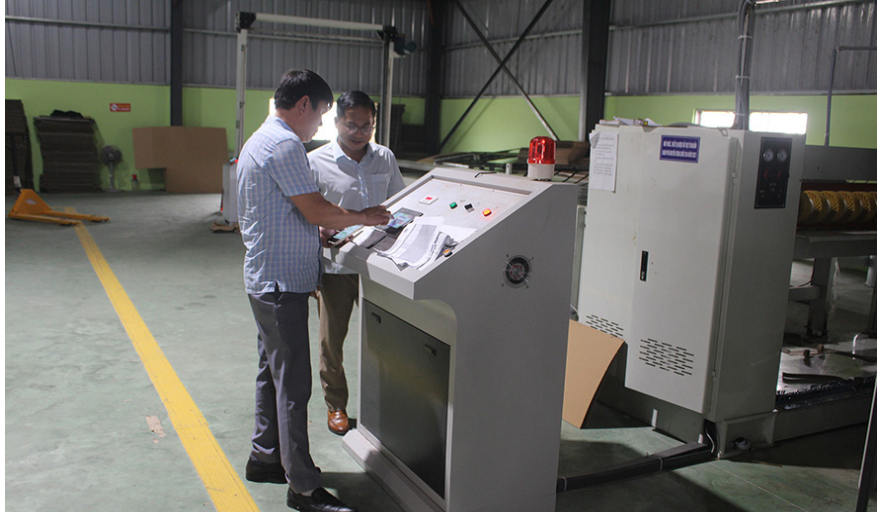
Hệ thống máy cắt chia khổ carton tự động được hỗ trợ một phần kinh phí từ nguồn vốn khuyến công quốc gia giúp Công ty Cổ phần Bao bì Carton Quảng Trị nâng cao chất lượng sản phẩm

Từ đầu năm đến nay, Sở Công Thương Quảng Trị đã chỉ đạo Trung tâm tổ chức ký hợp đồng và hướng dẫn các đơn vị thụ hưởng đề án triển khai thực hiện theo Quyết định số 1116/QĐ-UBND về việc phê duyệt danh mục đề án và kinh phí hỗ trợ khuyến công tỉnh năm 2023, tổng đề án được phê duyệt hỗ trợ là 12 đề án với kinh phí 1.730 triệu đồng (Trong đó: có 11 đề án ứng dụng máy móc thiết bị vào sản xuất và 01 đề án xây dựng mô hình trình diễn kỹ thuật sản xuất sản phẩm mới). Đã khuyến khích các doanh nghiệp, cơ sở CNNT thúc