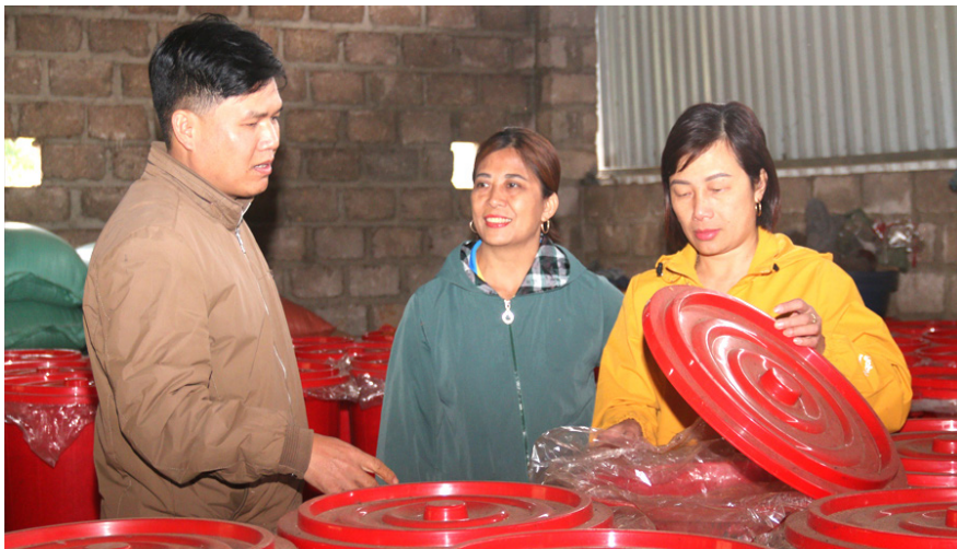
Lãnh đạo xã Bằng Phúc tham quan mô hình rượu men lá Bằng Phúc tại HTX rượu men lá Bằng Phúc.