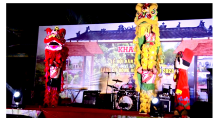
Khai mạc Lễ hội Văn hóa Du lịch Làng cổ Đông Hòa Hiệp

Làng cổ Đông Hòa Hiệp (tọa lạc xã Đông Hòa Hiệp, huyện Cái Bè, tỉnh Tiền Giang) là một khu Di tích