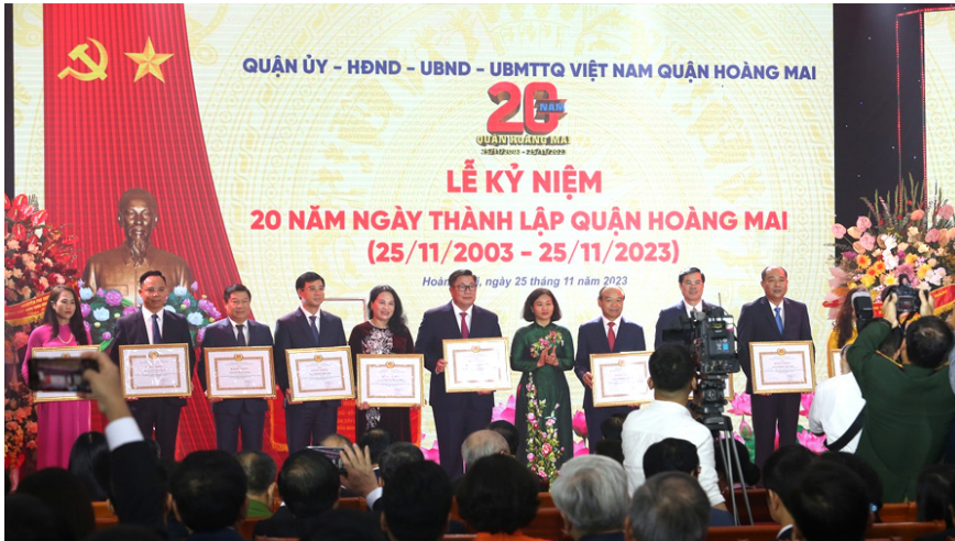
Thành phố Hà Nội khen thưởng cho các tập thể và cá nhân

20 năm qua, tận dụng lợi thế vị trí, tiềm năng cùng những bước đi khoa học, bài bản trên cơ sở tư duy đổi mới, quận Hoàng Mai đã phát triển mọi mặt, thay đổi cả về lượng và chất. Đến nay, dân số quận Hoàng Mai là trên 700 nghìn người. Giá trị sản xuất bình quân hàng năm luôn tục duy trì ở tốc độ tăng trưởng đạt 2 con số, từ 10,06% - 16,5% đảm bảo phát triển kinh tế ổn định, bền vững. Cơ cấu kinh tế của quận chuyển dịch theo đúng định hướng, tập trung tăng tỷ trọng các ngành thương mại, dịch vụ. Tổng thu ngân sách sau 20 năm thực hiện đạt gần 54.000 tỷ đồng, tăng thu hàng năm bình quân đạt 9%. Nguồn lực cho đầu tư phát triển tăng dần qua hàng năm, Quận đã triển khai 817 dự án đầu tư với tổng mức đầu tư gần 70.000 tỷ đồng.