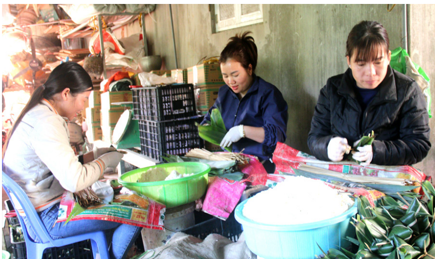
Đến với tỉnh Bắc Kạn du khách sẽ được trải nghiệm cùng làm những món ăn truyền thống như bánh gio, bánh tẻ...

Du lịch nông thôn đang được tỉnh Bắc Kạn chú trọng, đầu tư để góp phần làm "đòn bẩy" thúc đẩy phát triển kinh tế xã hội. Với tiềm năng lớn của du lịch nông thôn, ngành du lịch tỉnh đang xây dựng nhiều sản phẩm chất lượng, đa dạng, độc đáo thu hút du khách trong và ngoài nước.