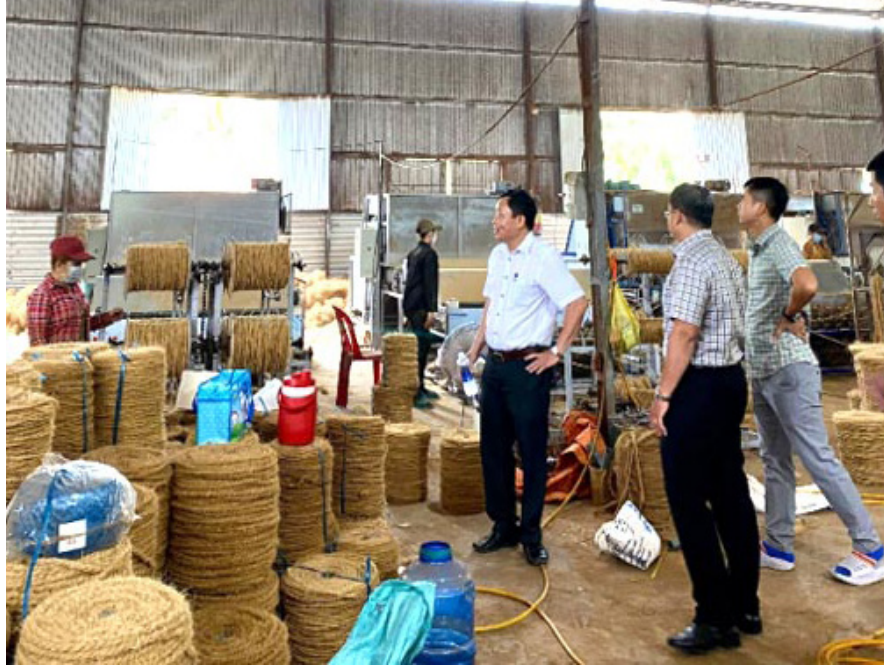
Nghiệm thu đề án đầu tư (Máy xe chỉ xơ dừa) tại Công ty TNHH Dừa Tân Hội

Từ khi được đầu tư máy móc thiết bị tiên tiến, tình hình sản xuất của Công ty TNHH Dừa Tân Hội đã có những thay đổi tích cực. Hệ thống máy tuốt chỉ xơ dừa ngoài việc tăng sản lượng sản xuất, còn giúp công ty tạo ra sản phẩm đồng nhất, hạn chế đứt chỉ, kẹt chỉ như máy móc cũ, giúp tiết kiệm thời gian và nguyên liệu đầu vào. Ngoài