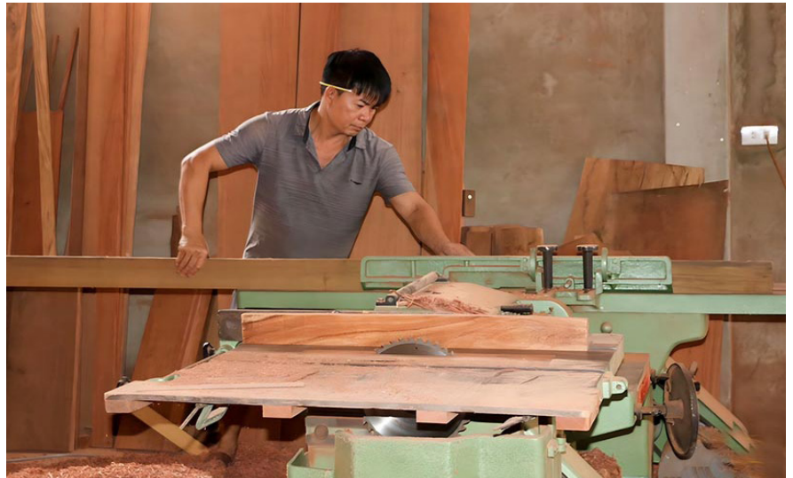
Làng mộc Thái Yên đóng góp hơn 70% tổng doanh thu công nghiệp - tiểu thủ công nghiệp của xã Thanh Bình Thịnh.

Được công nhận xã NTM kiểu mẫu lĩnh vực nổi trội về ngành nghề nông thôn với điểm nhấn là làng mộc truyền thống đã giúp xã Thanh Bình Thịnh, huyện Đức Thọ (Hà Tĩnh) mở ra nhiều cơ hội phát triển.