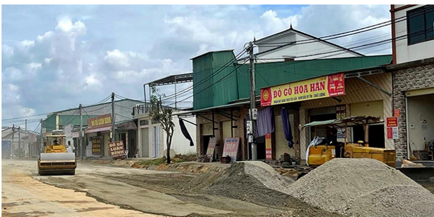
Những con đường mới được chỉnh trang, tạo tiền đề cho việc phát triển của xã Thanh Bình Thịnh.

Làng mộc Thái Yên chính là điểm nhấn trong xây dựng NTM tại địa