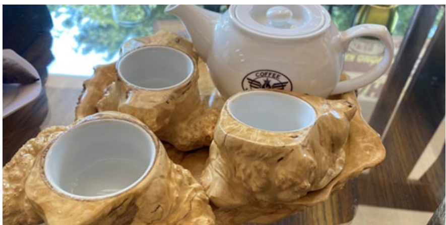
Một số sản phẩm thủ công mỹ nghệ độc đáo được chế tác từ gốc cây cà phê

tạo mà còn thể hiện tình yêu, thái độ trân quý của người thợ, người làm nghề đối với sản vật được thiên nhiên ban tặng. Tận dụng rễ cây trong việc điêu khắc cũng thể hiện