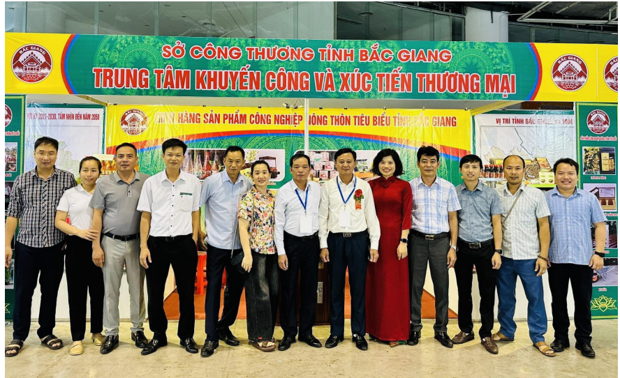
Lãnh đạo Sở Công Thương, Trung tâm khuyến công và xúc tiến thương mại tỉnh Bắc Giang chụp ảnh lưu niệm tại gian hàng

Tham gia Hội chợ, Trung tâm Khuyến công và Xúc tiến thương mại tỉnh Bắc Giang tổ chức 04 gian hàng trưng bày, bán các sản phẩm trái cây, nông sản đặc trưng, chủ lực, sản phẩm OCOP của tỉnh như: Vải thiều sấy khô, nước vải đóng lon, giấm vải thiều, mỳ gạo Chũ, đông trùng hạ thảo, sâm nam núi dành... Góp phần đẩy mạnh công tác quảng bá, giới thiệu các sản phẩm nông sản, trái cây; tạo cơ hội gặp gỡ, kết nối giữa các doanh nghiệp, hợp tác xã của tỉnh nhà với