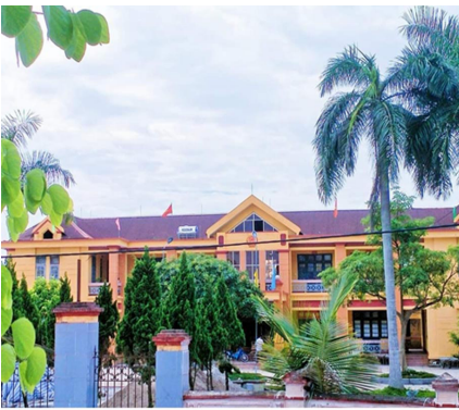
Trụ sở Đảng ủy, HĐND, UBND, Ủy Ban MTTQ xã Công Lý, nơi làm việc của Công đoàn xã Công Lý

Trong những năm qua dưới sự chỉ đạo, quản lý của Liên đoàn lao động huyện Lý Nhân (tỉnh Hà Nam) và sự lãnh đạo trực tiếp, toàn diện của Đảng ủy xã, BCH công đoàn cơ sở và đoàn viên công đoàn xã Công Lý đã nỗ lực phấn đấu hoàn thành xuất sắc nhiệm vụ được giao, góp phần tích cực vào quá trình xây dựng nông thôn mới của địa phương.