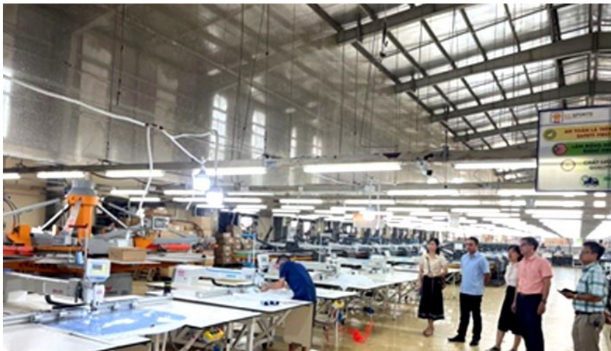
Nghiệm thu cơ sở tại Công ty TNHH KD Sports

Ngày 31 tháng 8 năm 2023, Trung tâm Khuyến công và Tư vấn phát triển công nghiệp 1 (Trung tâm 1) đã phối hợp với Sở Công Thương tỉnh Nam Định, các đơn vị có liên quan tổ chức nghiệm thu cơ sở nội dung hỗ trợ ứng dụng máy móc thiết bị tiên tiến cho 02 cơ sở công nghiệp nông thôn (cơ sở CNNT) trên địa bàn tỉnh Nam Định.