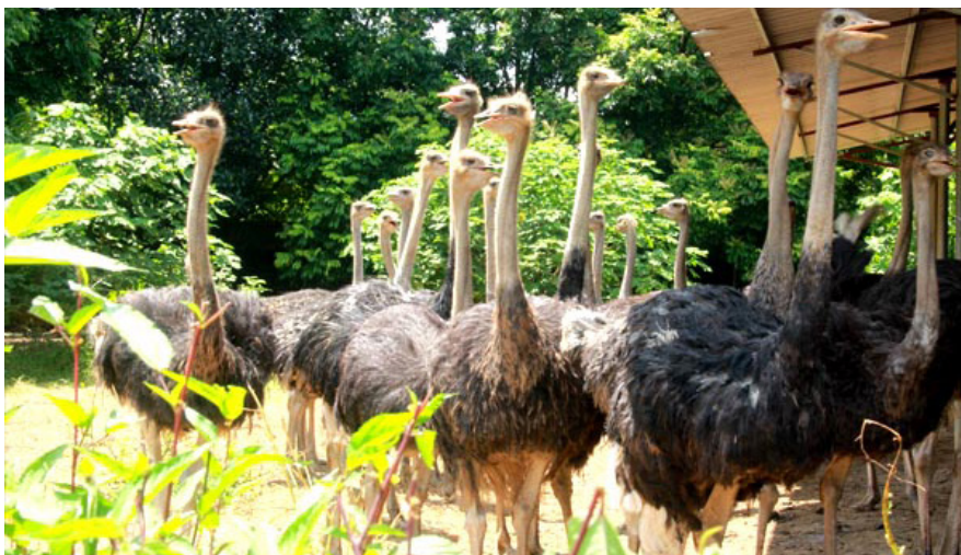
Tại huyện Ba Vi, hiện đã có hơn 200 hộ chăn nuôi đà điểu với số lượng hàng chục nghìn con trên địa bàn.

Sau hơn 12 năm nỗ lực triển khai thực hiện chương trình mục tiêu quốc gia xây dựng nông thôn mới, vượt qua những khó khăn của huyện miền núi Hà Nội. Từ việc triển khai những mô hình kinh tế nổi bật, tăng thu nhập người dân. Đến nay, 30/30 xã của huyện Ba Vi đã được công nhận đạt chuẩn nông thôn mới.