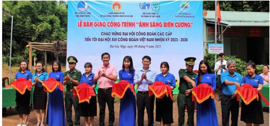
Đơn vị tài trợ trao tặng công trình “Ánh sáng biên cương” cho Đồn biên phòng Đắc Ô

Hướng đến chào mừng Đại hội Công đoàn các cấp tiến tới Đại hội XIII Công đoàn Việt Nam, nhiệm kỳ 2023 - 2028, ngày 8/9 vừa qua, Công đoàn cơ sở Sở Lao động, Thương binh và Xã hội Bình Phước phối hợp cùng Công ty cổ phần C.P Việt Nam tổ chức vận động và xây dựng Công trình “Ánh sáng biên cương” tại Đồn Biên phòng Đắc Ô (xã Đắc Ô, huyện Bù Gia Mập).