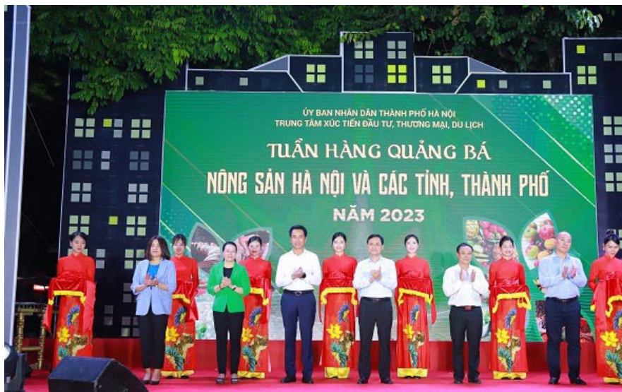
Các đại biểu cắt băng khai mạc Chương trình

"Đây là sự kiện xúc tiến nông nghiệp quan trọng đã được tổ chức thành công lần đầu tiên vào năm 2022, tiếp tục được kỳ vọng là cơ hội tốt để các đơn vị tham gia quảng bá sâu rộng thương hiệu, sản phẩm đến khách tham quan, người tiêu dùng Thủ đô; qua đó