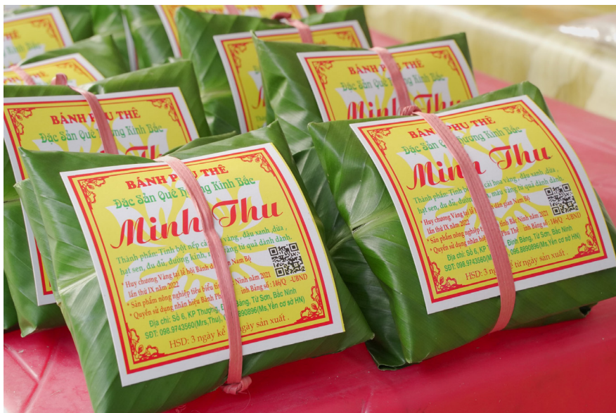
Bánh phu thê Minh Thu - sản phẩm OCOP 4 sao tỉnh Bắc Ninh

Không biết từ bao giờ, trong các đám cưới, đám hỏi của người Việt, đặc biệt là người Kinh Bắc lại không thể thiếu một loại bánh. Loại bánh tượng trưng cho sự thủy chung – bánh phu thê, một loại bánh ngọt cổ truyền của người Việt. Sở dĩ bánh gói thành cặp là bởi dân gian xưa quan niệm bánh phu thê là hình ảnh tượng trưng cho đôi lứa nên duyên vợ chồng. Màu xanh của lá bánh thể hiện sự thủy chung son sắt của người vợ Việt Nam, sợi lạt đỏ buộc