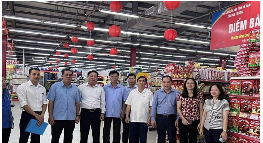
Đoàn kiểm tra việc thực hiện Cuộc vận động "Người Việt Nam ưu tiên dùng hàng Việt Nam" tại siêu thị Lan Chi (huyện Lý Nhân).

Thực hiện Cuộc vận động "Người Việt Nam ưu tiên dùng hàng Việt Nam" thời gian qua, các cấp, ngành, tầng lớp nhân dân trên địa bàn tỉnh Hà Nam đã vào cuộc tuyên truyền, vận động, giới thiệu quảng bá sản phẩm tới người tiêu dùng. Qua đó, làm thay đổi nhận thức của cả nhà sản xuất và người tiêu dùng đối với sản phẩm hàng hóa của Việt Nam, góp phần phát huy nội lực thúc đẩy phát triển kinh tế - xã hội các địa phương.