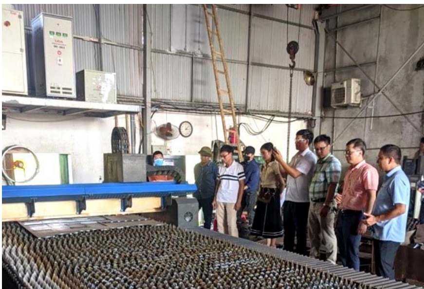
Nghiệm thu tại Công ty TNHH SX&TM kim khí Phúc Tiến

Nội dung nghiệm thu gồm: Hỗ trợ ứng dụng máy móc thiết bị tiên tiến trong sản xuất hàng may mặc xuất khẩu cho Công ty TNHH KD Sports (xã Thành Lợi, huyện Vụ Bản, tỉnh Nam Định); Hỗ trợ ứng dụng máy móc thiết bị tiên tiến trong sản xuất các sản phẩm cơ khí phục vụ dân dụng cho Công ty TNHH sản xuất và thương mại kim khí Phúc Tiến (thị trấn Xuân Trường, huyện Xuân Trường, tỉnh Nam Định).