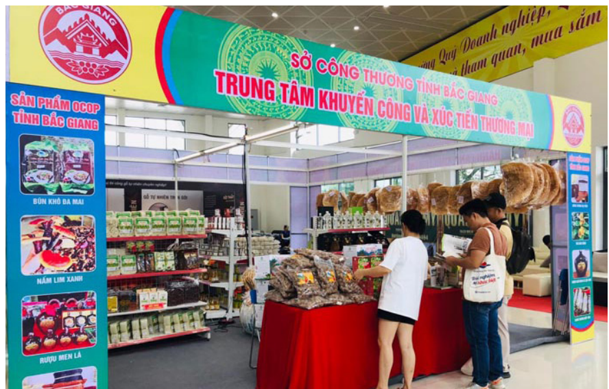
Trung tâm Khuyến công &XTTM tỉnh Bắc Giang tham gia trưng bày gian hàng tại hội chợ

các tỉnh, thành phố trên cả nước; hình thành chuỗi liên kết, mở rộng thị trường tiêu thụ, phát triển mạng lưới phân phối các sản phẩm OCOP, sản phẩm nông sản chủ lực, đặc trưng của tỉnh Bắc Giang trên địa bàn thành phố Đà Nẵng.