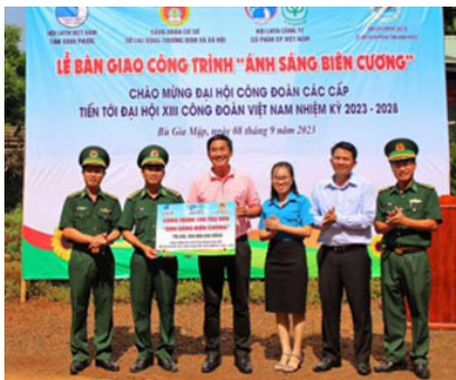
Đại biểu cắt băng khánh thành công trình “Ánh sáng biên cương”