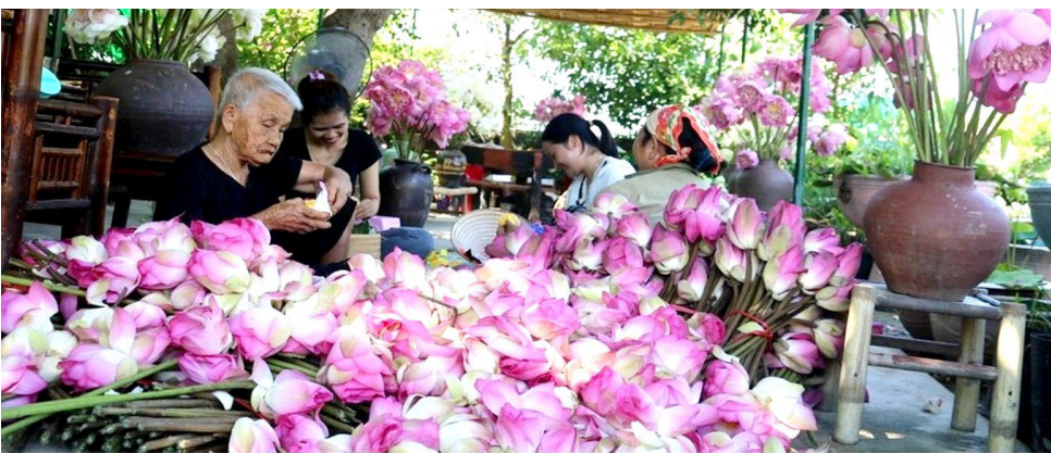
Người dân làng Sen sơ chế các sản phẩm tách ra từ hoa sen