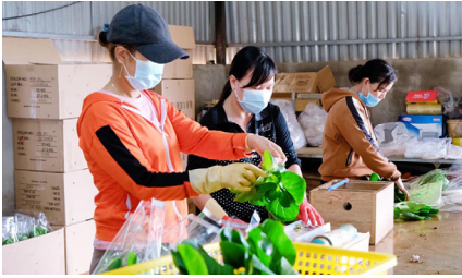
Công tác khuyến công tại huyện Đơn Dương chú trọng đầu tư phát triển các máy móc, thiết bị phục vụ sản xuất nông nghiệp

Sau 10 năm thực hiện Nghị định số 45/2012/NĐ-CP của Chính phủ về khuyến công, tình hình sản xuất công nghiệp - tiểu thủ công nghiệp (CN - TTCN) trên địa bàn huyện Đơn Dương, tỉnh Lâm Đồng từng bước được ổn định. Giá trị sản xuất của ngành năm sau tăng so với năm trước, đáp ứng ngày càng tốt hơn nhu cầu sản xuất, kinh doanh và phục vụ đời sống nhân dân.