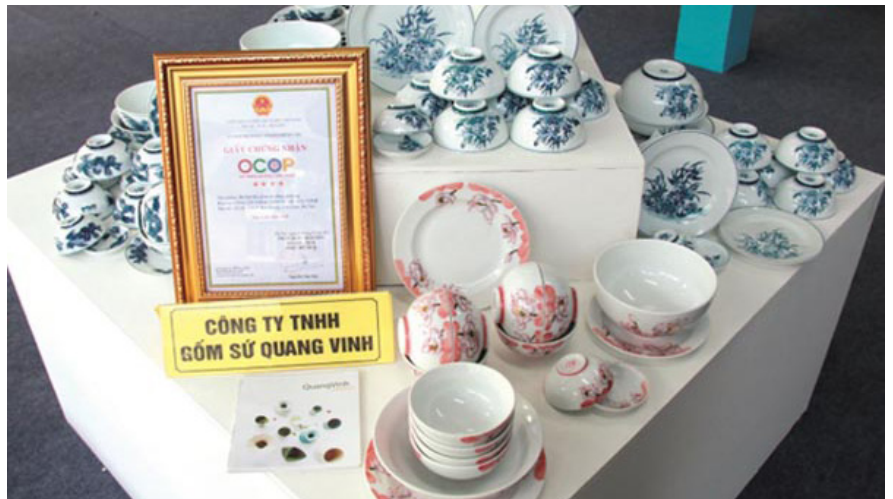
Sản phẩm OCOP đạt 5 sao của TP Hà Nội.

tham quan, mua sắm: Xã Bát Tràng (huyện Gia Lâm), xã Đường Lâm (thị xã Sơn Tây), làng Vạn Phúc (phường Vạn Phúc, quận Hà Đông). Các điểm bán và giới thiệu sản phẩm OCOP giúp người tiêu dùng thuận tiện khi mua sắm và giúp các chủ thể OCOP tiêu thụ sản phẩm tốt hơn.