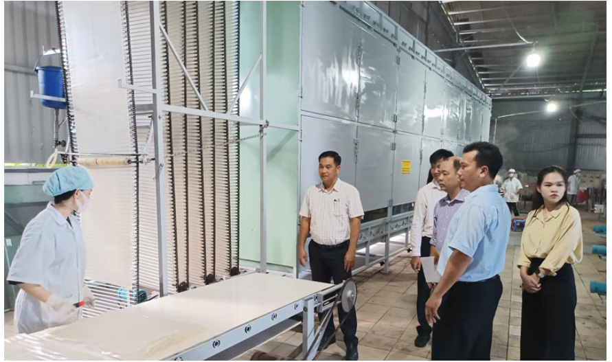
Hình ảnh nghiệm thu cơ sở nhiệm vụ khuyến công tại Hộ kinh doanh Cơ sở hủ tiếu Chu Hải

Trung tâm Khuyến công và Tư vấn phát triển công nghiệp tỉnh Bà Rịa-Vũng Tàu đã hỗ trợ một phần kinh phí trên tổng kinh phí đầu tư 616 triệu đồng cho Hộ kinh doanh Cơ sở hủ tiếu Chu Hải để ứng dụng máy móc thiết bị tiên tiến trong sản xuất hủ tiếu từ nguồn kinh phí khuyến công địa phương năm 2023.