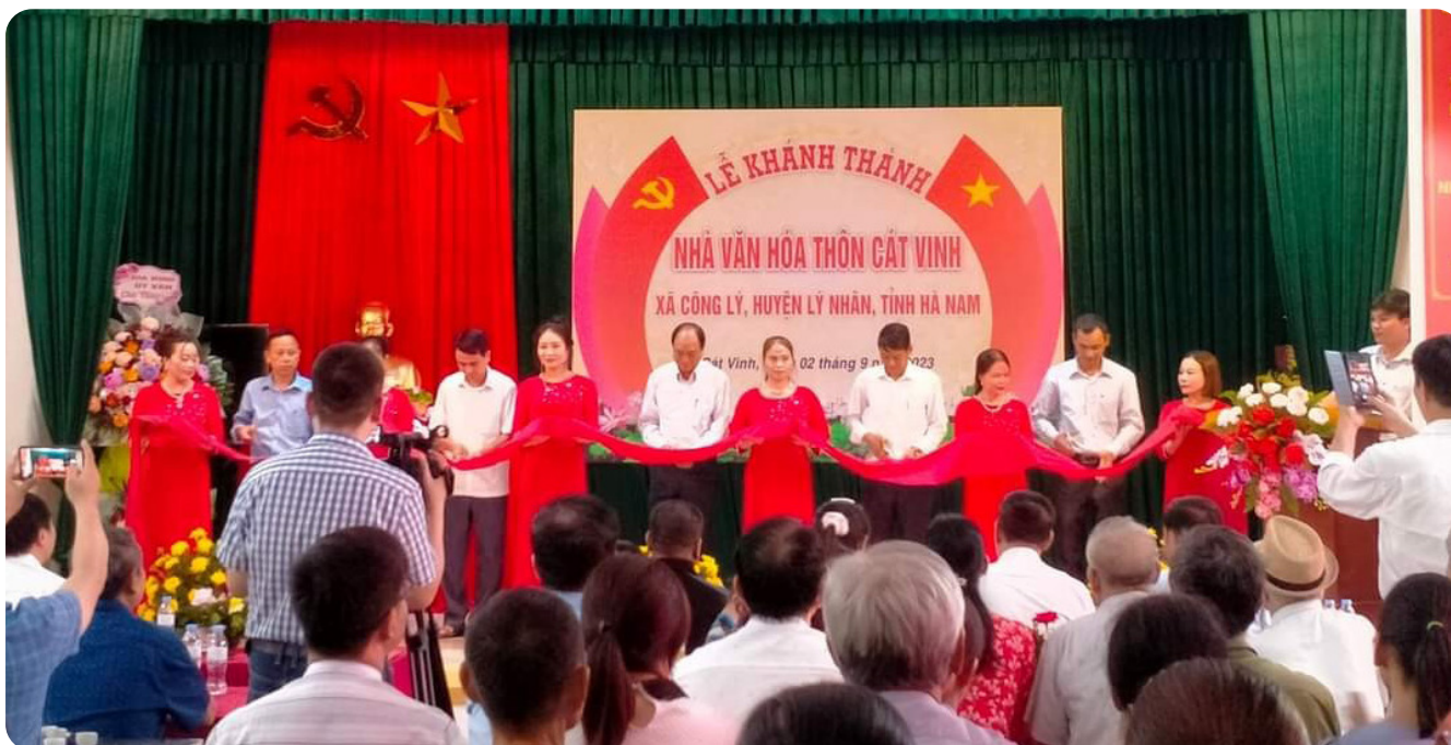
Lãnh đạo địa phương cắt băng khánh thành NVH