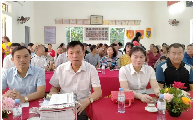
Các đại biểu và lãnh đạo địa phương tới dự hội nghị