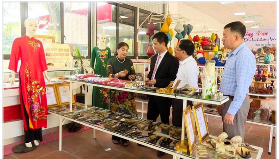
Một điểm giới thiệu và bán sản phẩm OCOP làng nghề của huyện Thường Tín, Hà Nội.

Trước những thách thức với làng nghề thủ công truyền thống, TP. Hà Nội đã và đang hỗ trợ làng nghề xây dựng những điểm giới thiệu, bán và trưng bày sản phẩm thủ công mỹ nghệ, sản phẩm lưu niệm... nhằm quảng bá tinh hoa làng nghề cũng như tăng tính trải nghiệm cho du khách khi đến với Thủ đô.