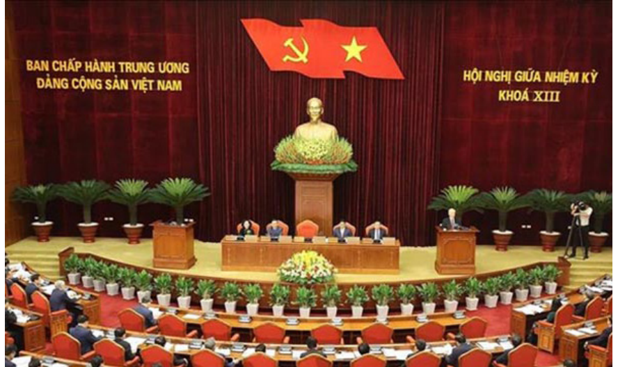
Quang cảnh hội nghị.

Thay mặt lãnh đạo Đảng, Nhà nước và với tình cảm cá nhân, Tổng