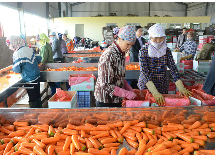
Mô hình chế biến cà rốt xuất khẩu tại xã Minh Tân, huyện Lương Tài, Bắc Ninh.

mỗi xã, phường, thị trấn một sản phẩm (Chương trình OCOP), nhằm phát huy lợi thế tại mỗi địa phương; thúc đẩy phát triển dịch vụ du lịch nông thôn mới, cộng đồng dịch vụ du lịch nông thôn mới; Phát triển các hình thức hợp tác, liên kết trong sản xuất, tiêu thụ nông sản; thu hút các doanh nghiệp, tập đoàn đầu tư vào nông nghiệp quy mô lớn, lĩnh vực chế biến nông sản và lĩnh vực phi nông nghiệp, tạo nhiều việc làm. Hình thành hệ thống trung tâm kết nối, xúc tiến, xuất khẩu sản phẩm gắn với chuỗi các chợ đầu mối hoặc trung tâm cung ứng hàng nông sản.