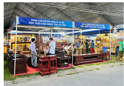
Khu trưng bày giới thiệu sản phẩm Hội chợ gỗ mỹ nghệ Đồng Kỵ

Tham gia Hội chợ công thương vùng đồng bằng sông Hồng - Hà Nam 2023, Trung tâm Khuyến công và tư vấn phát triển công nghiệp tỉnh Bắc Ninh tổ chức khu trưng bày giới thiệu sản phẩm làng nghề truyền thống của địa phương (trưng bày sản phẩm Gỗ Đồng Kỵ) nhằm đẩy mạnh chương trình xúc tiến thương mại, phát triển kênh lưu thông hàng hóa, góp phần phát triển sản xuất hàng hóa trong nước, đồng thời giúp các doanh nghiệp nắm bắt cơ hội, tìm kiếm mở rộng thị trường, đẩy mạnh hợp tác liên doanh liên kết, phát huy tiềm năng thế mạnh.