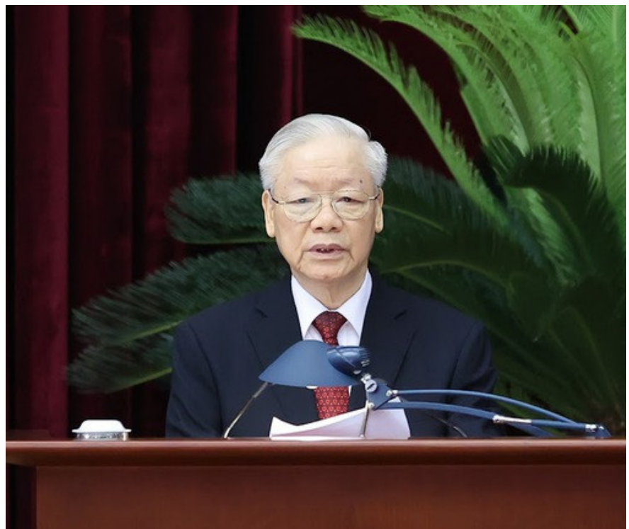
Tổng Bí thư Nguyễn Phú Trọng phát biểu khai mạc Hội nghị

Bí thư Nguyễn Phú Trọng chúc toàn thể các đồng chí Ủy viên Trung ương, các đại biểu tham dự Hội nghị và các cấp uỷ, chính quyền, đồng bào, chiến sĩ cả nước tiếp tục phát huy những thành tích, kết quả và bài học kinh nghiệm đã đạt