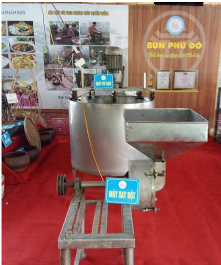
Máy làm bún tiết kiệm năng lượng ở làng nghề bún Phú Đô.

Thứ nhất, Luật Năng lượng tái tạo và tiết kiệm năng lượng (sửa đổi và bổ sung) năm 2020 là một sửa đổi quan trọng của Luật Năng lượng tái tạo và tiết kiệm năng lượng của Việt Nam năm 2015. Luật sửa đổi này được Quốc hội thông qua vào ngày 17 tháng 11 năm 2020 và chính thức có hiệu lực từ ngày 1 tháng 1 năm 2021. Luật sửa đổi này tập trung vào nhiều mục tiêu, bao gồm tăng cường sử dụng năng lượng tái tạo, tăng cường hiệu quả năng lượng và giảm lượng khí thải nhà kính. Các điểm đáng chú ý trong Luật sửa đổi bao gồm: Mục tiêu năng lượng tái tạo: Luật sửa đổi đặt mục tiêu năng lượng tái tạo chiếm 15-20% tổng sản lượng điện trong nước vào năm 2030 và 25% vào năm 2045. Khuyến khích đầu tư năng lượng tái tạo: Luật sửa đổi tăng cường khuyến khích đầu tư vào các dự án năng lượng tái tạo và cung cấp các chính sách hỗ trợ thuận lợi cho các nhà đầu tư. Luật sửa đổi yêu cầu các tổ chức, doanh nghiệp và cá nhân tăng cường sử dụng thiết bị tiết kiệm năng lượng,