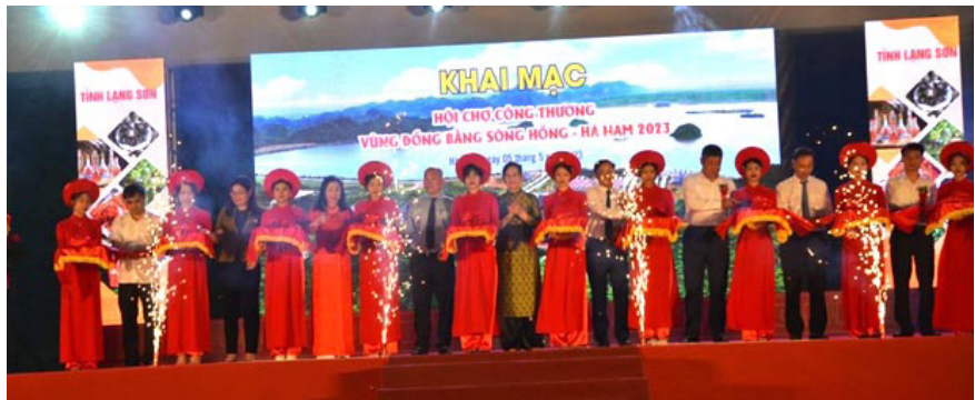
Các đại biểu cắt băng khai mạc Hội chợ Công thương vùng đồng bằng sông Hồng-Hà Nam 2023.

Thực hiện Quyết định số 2924/QĐ-BCT ngày 28/12/2022 của Bộ trưởng Bộ Công Thương phê duyệt Chương trình cấp quốc gia về Xúc tiến thương mại năm 2023, Bộ Công Thương và Ủy ban nhân dân tỉnh Hà Nam vừa phối hợp tổ chức khai mạc Hội chợ Công Thương vùng đồng bằng sông Hồng - Hà Nam năm 2023 tại Sân vận động thành phố Phủ Lý. Hội chợ với sự tham gia gần 300 gian hàng của các tỉnh, thành phố trong khu vực.