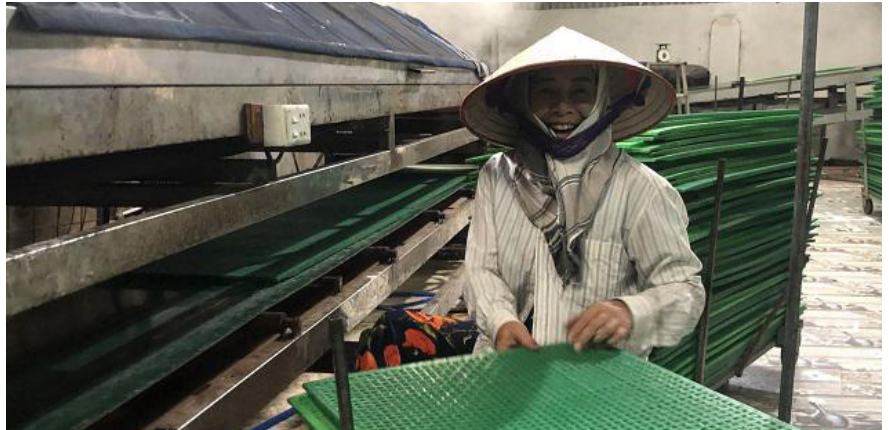
Làng nghề bánh đa nem Ngự Cầu (An Thượng, Hoài Đức) ứng dụng công nghệ vào sản xuất.

TTg của Thủ tướng Chính phủ về phê duyệt Chiến lược quốc gia về tiết kiệm năng lượng đến năm 2030, tầm nhìn đến năm 2050. Quyết định này quy định các mục tiêu và biện pháp để tăng cường tiết kiệm năng lượng và sử dụng hiệu quả năng lượng trong các ngành công nghiệp, dân dụng, giao thông vận tải, đô thị và nông nghiệp. Quyết định số 353/QĐ-TTg là một chính sách quan trọng của Chính phủ Việt Nam về việc phát triển và thúc đẩy tiết kiệm năng lượng. Quyết định này được ban hành vào ngày 28 tháng 2 năm 2017 bởi Thủ tướng Chính phủ Việt Nam. Mục tiêu chính của chiến lược này như sau: Tăng cường tiết kiệm năng lượng trong các ngành công nghiệp, xây dựng, giao thông vận tải, nông nghiệp và các lĩnh vực khác. Phát triển và ứng dụng các công nghệ, thiết bị tiết kiệm năng lượng và các nguồn năng lượng tái tạo. Giảm tỷ lệ lãng phí năng lượng, tăng cường hiệu quả sử dụng năng lượng. Tăng cường tuyên truyền, nâng cao nhận thức về tiết kiệm năng lượng và các giải pháp tiết kiệm năng lượng. Tăng cường tiết kiệm năng lượng trong các ngành công nghiệp, đạt mức tiết kiệm 10-15% vào năm 2030. Phát triển và sử dụng các nguồn năng lượng tái tạo, đạt mức sử dụng 10% vào năm 2030. Giảm tỷ lệ lãng phí năng lượng trong các ngành sản xuất và vận hành hệ thống, giảm mức lãng phí năng lượng đến 3% vào năm 2030. Tăng