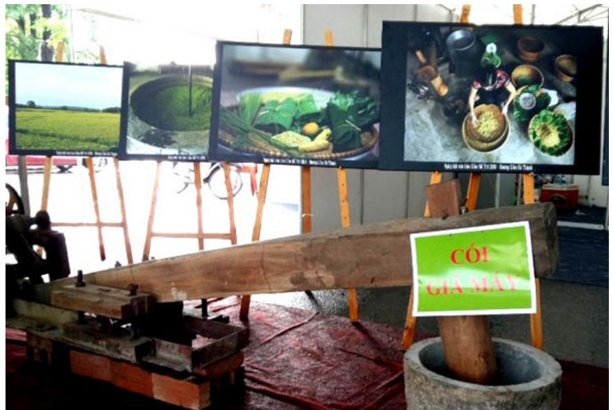
Máy làm cốm ở làng cốm Mễ Trì.

Các chính sách và luật sử dụng năng lượng tiết kiệm hiệu quả đã giúp làng nghề Việt Nam đang đẩy mạnh phát triển các nguồn năng lượng mới và tái tạo; giảm sự phụ thuộc vào các nguồn năng lượng truyền thống, tăng cường sử dụng các giải pháp tiết kiệm năng lượng và đẩy mạnh nghiên cứu, phát triển các công nghệ mới trong lĩnh vực năng lượng; tăng năng suất lao động, giúp giảm thiểu ô nhiễm, tối ưu hóa sử dụng năng lượng và giảm chi phí. Bên cạnh đó có những tác động tiêu cực đến làng nghề như: Thay đổi cách thức sản xuất truyền thống của các làng nghề, có thể mất thị phần và không còn cạnh tranh được trên thị trường; giảm nhu cầu về lao động, việc thay đổi cách sản xuất có thể ảnh hưởng đến các giá trị văn hóa truyền thống, thay đổi kỹ thuật sản xuất; chi phí đầu tư năng lượng tăng cao, xử lý môi trường.