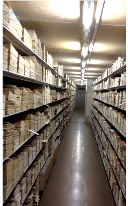
Tài liệu này chỉ có bản sao phát hiện được trong kho lưu trữ Bộ Tài chính, hiện đang được bảo quản tại Trung tâm Lưu trữ Quốc gia III (Hà Nội)