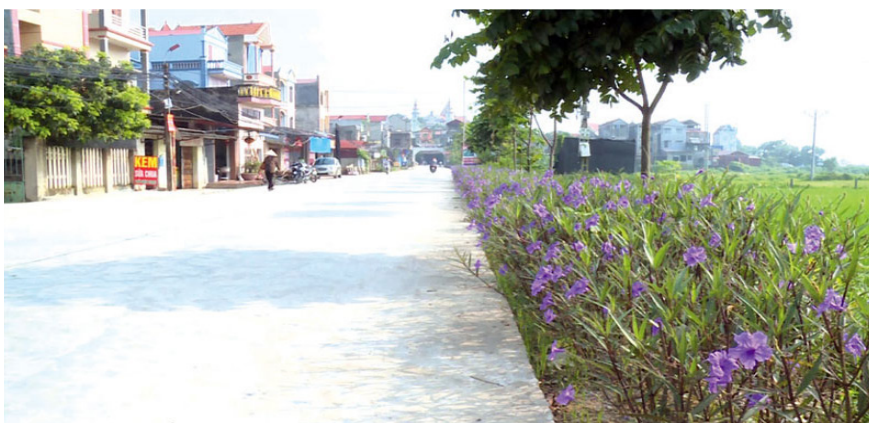
Trên 90% các tuyến đường nông thôn ở Cách Bi, huyện Quế Võ, Bắc Ninh đã trở thành "đường hoa".

Tập trung đẩy nhanh tiến độ thực hiện cơ cấu lại ngành Nông nghiệp theo hướng bền vững, đổi mới mô hình tăng trưởng, nhằm phát huy lợi thế về địa hình, khí hậu, cảnh quan thiên nhiên, hạ tầng kinh tế - xã hội. Trong đó tập trung vào: Thúc đẩy phát triển các vùng sản xuất tập trung quy mô lớn, cơ giới hóa đồng bộ gắn với mô hình liên kết sản xuất chuỗi giá trị, chú trọng phát triển nông nghiệp sạch, nông nghiệp hữu cơ, nông nghiệp ứng dụng công nghệ cao gắn với áp dụng các quy trình kỹ thuật chuẩn và cấp mã vùng sản xuất; Tiếp tục phát triển các sản phẩm, ngành nghề nông thôn theo Chương trình