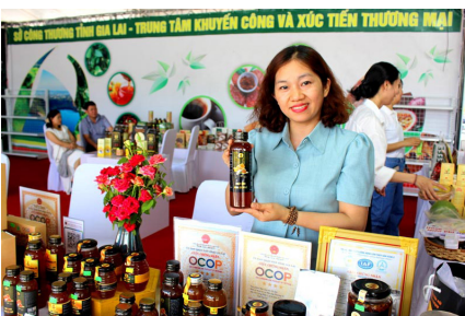
Một góc trưng bày sản phẩm của tỉnh Gia Lai.

Khu vực Miền Trung – Tây Nguyên được đánh giá là khu vực giàu tiềm năng, lợi thế phát triển, hứa hẹn trở thành một vùng kinh tế năng động. Tốc độ tăng trưởng của khu vực bình quân hàng năm đạt từ 9,5 – 11%, cơ sở hạ tầng kinh tế đã từng bước hoàn thiện với sự hình thành và phát triển của các khu công nghệ cao, 57 khu công nghiệp, 7 khu kinh tế, 4 cảng nước sâu, 166 cụm công nghiệp, 132 siêu thị, 21 trung tâm thương mại... và là địa chỉ hấp dẫn thu hút đầu tư trong và ngoài nước.