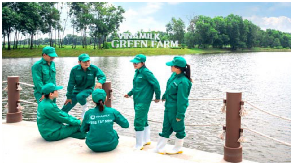
Vinamilk tập trung xây dựng văn hóa Tôn trọng, cởi mở, hợp tác, kết nối, tôn trọng sự khác biệt và thúc đẩy sáng tạo

Cụ thể, doanh nghiệp luôn nỗ lực trong việc xây dựng văn hóa Tôn trọng, cởi mở, hợp tác, kết nối, tôn trọng sự khác biệt và thúc đẩy sáng tạo. Môi trường làm việc hấp dẫn phải luôn tạo được sự hòa hợp, kết nối và phát huy được thế mạnh của nhiều thế hệ, trong đó thế hệ Gen Z dần trở thành lực lượng lao động quan trọng mới.