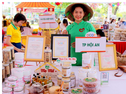
Sản phẩm của thương hiệu “Mẹ Mít” (TP. Hội An, Quảng Nam).

nhằm đẩy mạnh hỗ trợ các doanh nghiệp tiếp tục sản xuất, kinh doanh, kết nối cung cầu giữa các doanh nghiệp với các nhà phân phối, doanh nghiệp xuất khẩu và tổ chức xúc tiến thương mại nước ngoài. Ngày hội do Cục Xúc tiến Thương mại (Bộ Công Thương) phối hợp với Sở Công Thương các tỉnh, thành phố khu vực trên tổ chức.