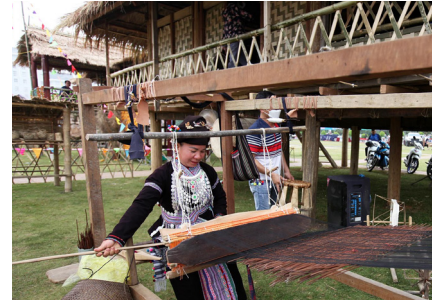
Tỉnh sẽ tiếp tục khôi phục và phát triển một số ngành nghề thủ công.

Đơn vị làm công tác khuyến công cũng có nhiệm vụ hỗ trợ nâng cao năng lực quản lý doanh nghiệp, nhận thức và năng lực áp dụng sản xuất sạch hơn trong công nghiệp thông qua các lớp tập huấn và hỗ