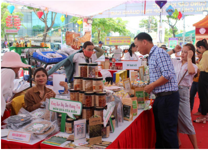
Các doanh nghiệp và các nhà phân phối giao lưu trực tiếp để tìm kiếm cơ hội hợp tác.