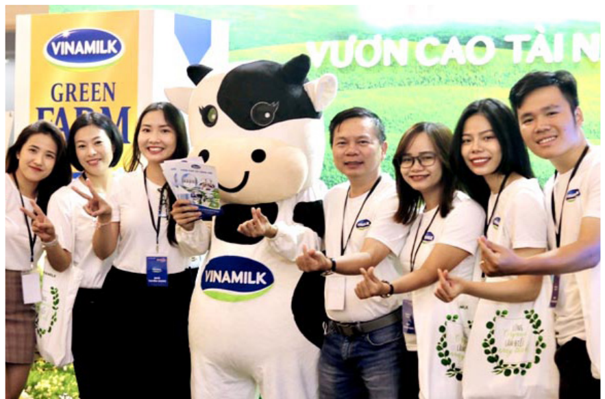
Vinamilk tiếp tục dẫn đầu danh sách Nhà tuyển dụng được yêu thích nhất năm 2022 của CareerBuilder

Liên tục triển khai những chính sách tiên tiến hướng đến hoàn thiện môi trường làm việc, đem lại cơ hội phát triển cho người lao động ngay cả trong những giai đoạn thách thức của nền kinh tế, công ty Vinamilk được tổ chức Career Builder bình chọn là doanh nghiệp dẫn đầu trong Top 100 Nhà tuyển dụng được yêu thích nhất năm 2022.