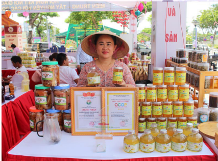
Sản phẩm đạt Ocop 4 sao của huyện Đại Lộc (Quảng Nam).

Sáng 11-5, tại TP Đà Nẵng, Cục Xúc tiến thương mại Bộ Công Thương phối hợp với UBND TP Đà Nẵng và các tỉnh trong khu vực Miền Trung – Tây Nguyên tổ chức lễ khai mạc Hội nghị “Kết nối giao thương giữa nhà cung cấp khu vực Miền Trung – Tây Nguyên với các doanh nghiệp xuất khẩu và các tổ chức xúc tiến thương mại nước ngoài”.