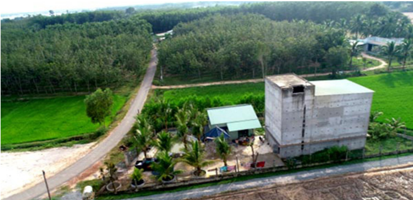
Để duy trì nghề nuôi chim yến trong nhà, chuyên gia khuyến cáo những nhà yến cách khu dân cư dưới 300m, không được phép sử dụng loa phát thanh.

miễn dịch, rối loạn giấc ngủ,... Nghiên cứu y học cho thấy những người thường xuyên tiếp xúc với tiếng ồn, ngưỡng đáp ứng của thần kinh thính giác tăng, dẫn đến mất khả năng nhạy cảm thông thường, dần dần không cảm ứng với âm tần có cường độ thấp. Ngoài ra, việc thường xuyên tiếp xúc với tiếng ồn có độ lớn trên 80 decibel có thể làm giảm thính lực.