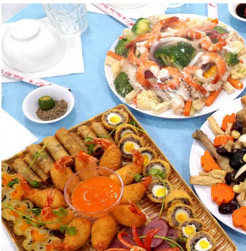
Các món ăn tham gia hội thi được trình bày với hình thức phong phú, bắt mắt và đậm đà hương vị miền Tây.