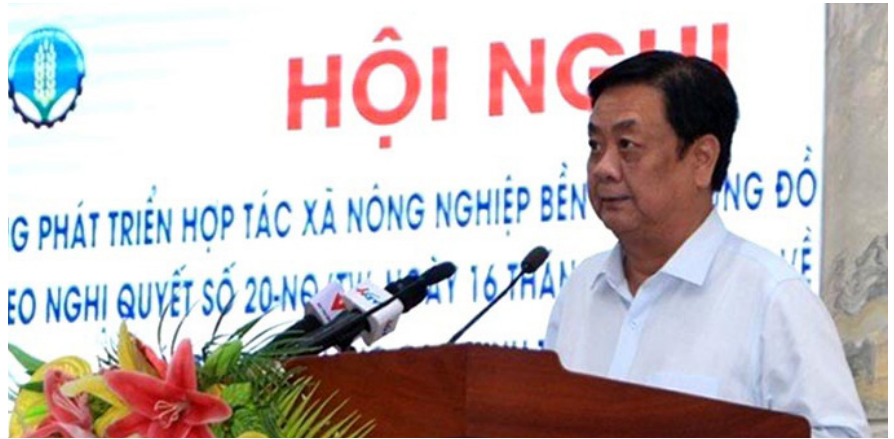
Ông Lê Minh Hoan, Bộ trưởng Bộ NN&PTNT phát biểu tại Hội nghị.