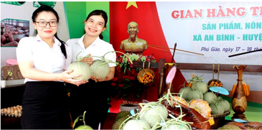
Sản phẩm dưa lưới của HTX nông nghiệp công nghệ cao Kim Long đạt chứng nhận OCOP 3 sao.

Hội đồng đánh giá, phân hạng sản phẩm OCOP cho biết, đến nay tỉnh Bình Dương có 31 chủ thể kinh tế có sản phẩm đạt chứng nhận OCOP với 47 sản phẩm đạt chứng nhận OCOP từ 3 sao trở lên. Trong đó, có 8 sản phẩm 4 OCOP sao và 39 sản phẩm OCOP 3 sao.