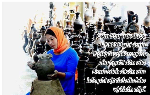
Gốm Bàu Trúc được UNESCO ghi danh “Nghệ thuật làm gốm của người dân vào Danh sách di sản văn hóa phi vật thể cần bảo vệ khẩn cấp”.

Hiện nay, UBND tỉnh Ninh Thuận giao nhiệm vụ cho các đơn vị rà soát, xây dựng chương trình, chuẩn bị kỹ lưỡng từng hoạt động thuộc Lễ hội. Sự kiện này là dịp giới thiệu quảng bá nho là sản phẩm đặc trưng của Ninh Thuận, vinh danh di sản nghệ thuật làm gốm độc đáo của người Chăm. Ngoài ra, định hướng quảng bá tiềm năng du lịch, chế biến rượu vang và các sản phẩm nông nghiệp khác thuộc tỉnh Ninh Thuận. Qua đó, tạo cơ hội giao lưu, hợp tác và đầu tư giữa doanh nghiệp trong và ngoài nước.