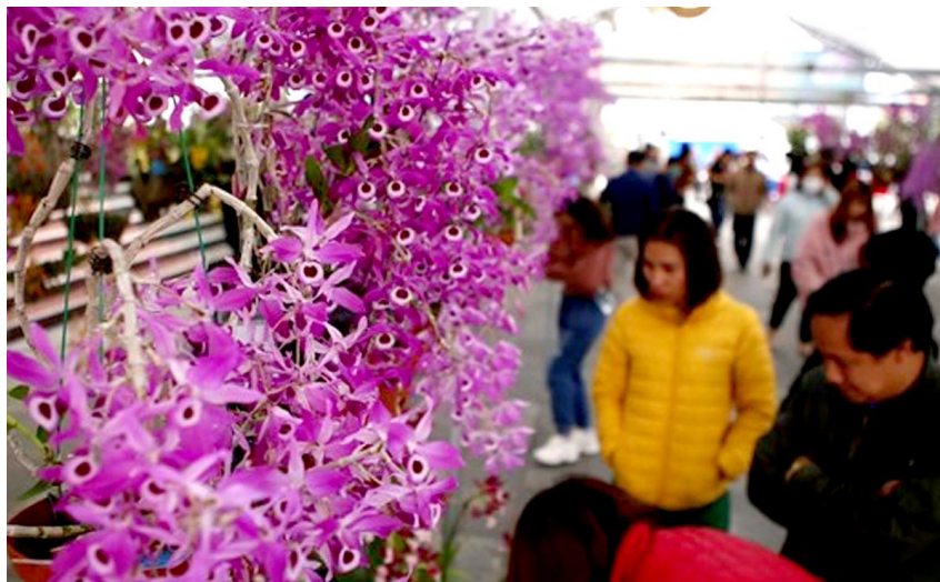
Du khách được ngắm nhiều loại phong lan đẹp với nhiều chủng loại khác nhau tại triển lãm.

Sáng 9/4, tại thành phố Lai Châu, tỉnh Lai Châu, Câu lạc bộ hoa lan Lai Châu tổ chức triển lãm hoa lan, thi hoa lan lần thứ 6 với chủ đề "Hương sắc Lai Châu."