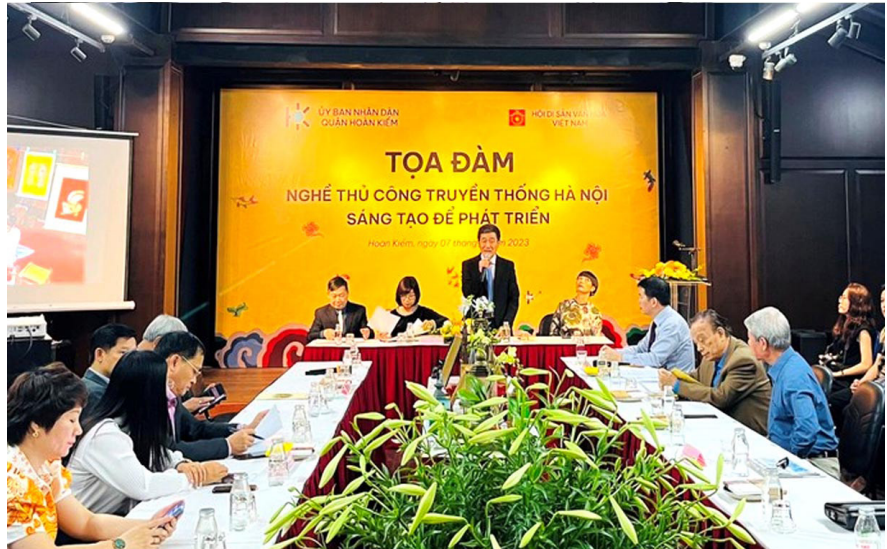
Các đại biểu trao đổi về những giải pháp đổi mới, phát huy giá trị nghề thủ công truyền thống.

liệu di sản nghề thủ công truyền thống một cách khoa học, với phương thức quản lý thống nhất, tiếp cận dễ dàng, tạo điều kiện thuận lợi cho cộng đồng sáng tạo thể nghiệm, thực hành những sáng tạo mới, mang lại những giá trị mới cho di sản. Tạo nguồn quỹ phục vụ bảo tồn, lưu giữ tri thức dân gian