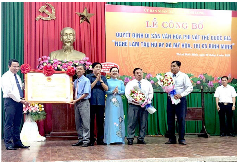
Đại diện làng nghề tàu hũ ky Mỹ Hòa nhận Quyết định của Bộ Văn hóa, Thể thao và Du lịch tại hạng mục Di sản văn hóa phi vật thể quốc gia.

Hiện nay ở làng Dư Dụ, hơn 90% người dân làm nghề điêu khắc, và nghề điêu khắc ở Dư Dụ đang ngày càng phát triển, sản phẩm làm ra đến đâu là đưa đi tiêu thụ đến đó. Tin rằng khi nghề truyền thống của Dư Dụ được truyền lại theo cách "cha truyền - con nối" sẽ giúp làng Túc ngày càng vươn xa hơn nữa.