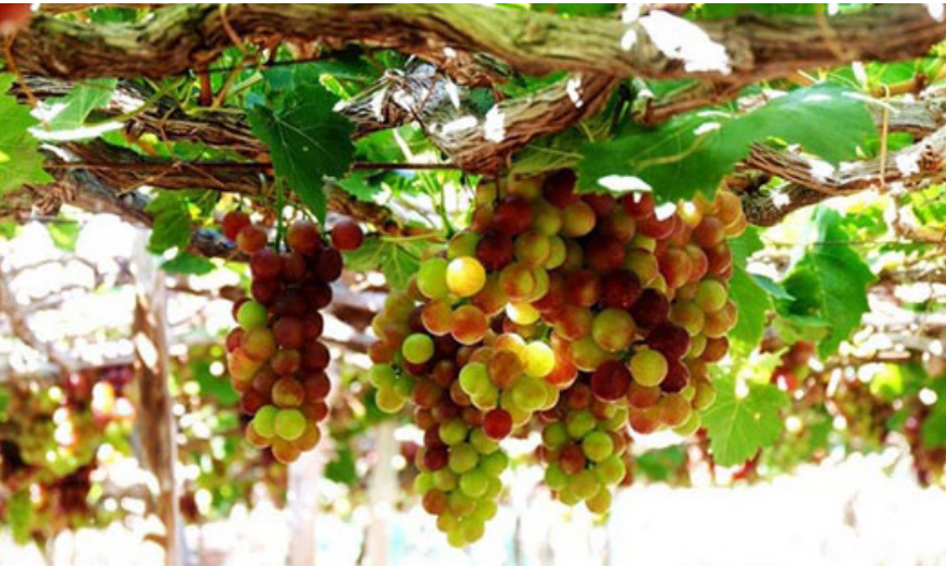
Nho là một sản phẩm đặc trưng của tỉnh Ninh Thuận.

Mới đây, UBND tỉnh Ninh Thuận đã ban hành kế hoạch tổ chức Lễ hội Nho và Vang Ninh Thuận 2023 cùng với việc đón nhận UNESCO ghi danh “Nghệ thuật làm gốm của người Chăm vào Danh sách di sản văn hóa phi vật thể cần bảo vệ khẩn cấp”.