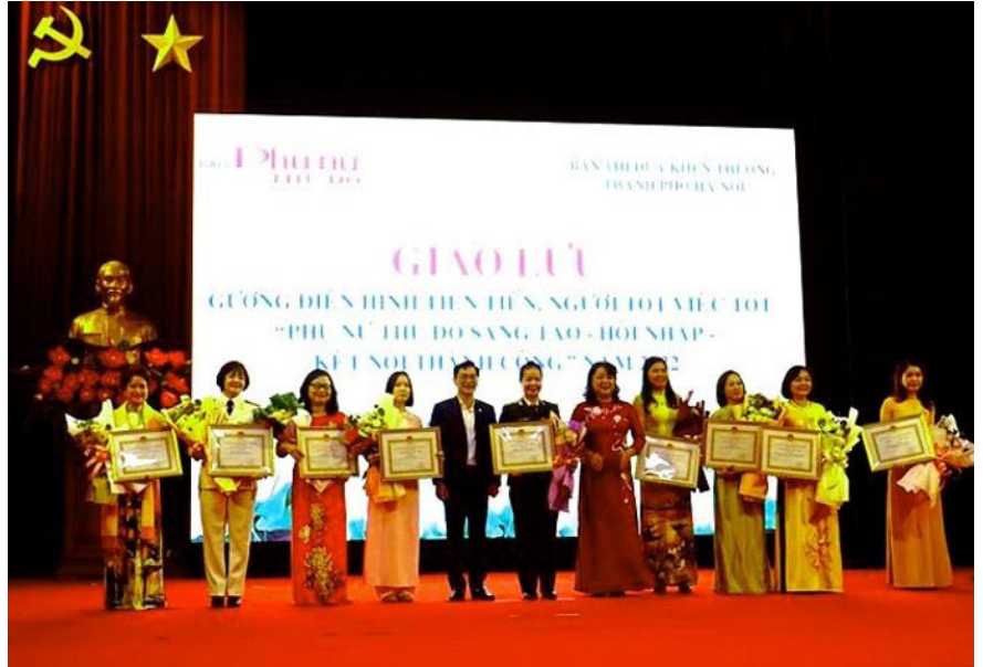
Phụ nữ Thủ đô tôn vinh các gương điển hình tiên tiến Người tốt, việc tốt năm 2022.