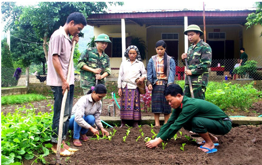
Cán bộ, nhân viên Đoàn Kinh tế-Quốc phòng 337 hướng dẫn bà con thôn Tà Bàng xã Hướng Lập, huyện Hướng Hóa (tỉnh Quảng Trị) trồng rau sạch.

Thôn Tà Bàng, xã Hướng Lập, huyện Hướng Hóa (Quảng Trị) có sự đổi thay mạnh mẽ, tuyến đường vào thôn Tà Bàng nhỏ hẹp, uốn theo bờ sông Sê Bàng Hiêng ngày nào giờ đã được mở rộng, tạo điều kiện thuận lợi cho bà con giao thương, phát triển kinh tế.