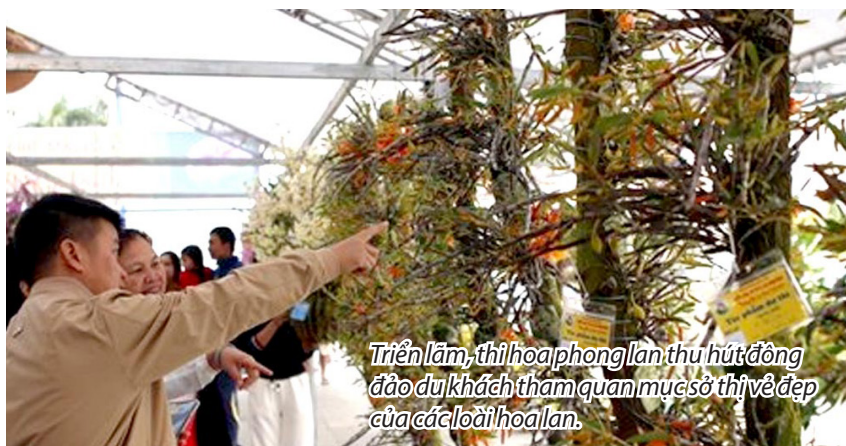
Triển lãm, thi hoa phong lan thu hút đông đảo du khách tham quan mục sở thị vẻ đẹp của các loài hoa lan.