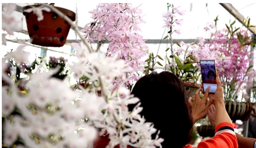
Du khách chụp ảnh những giò hoa phong lan độc đáo được trưng bày tại triển lãm.