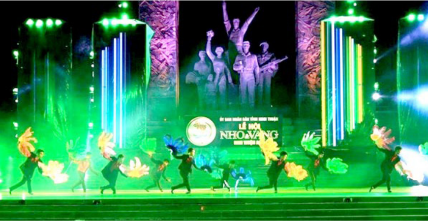
Lễ hội Nho và Vang Ninh Thuận năm 2023 là sự kiện lớn của tỉnh Ninh Thuận.