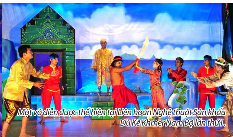
Một vở diễn được thể hiện tại Liên hoan Nghệ thuật Sân khấu Dù Kê Khmer Nam Bộ lần thứ I.