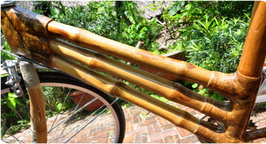
Toàn bộ các mối nối đều được quấn bằng dây gai