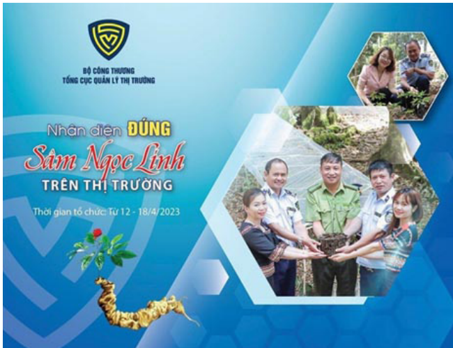
Tuần lễ “Nhận diện đúng sâm Ngọc Linh trên thị trường” diễn ra từ ngày 12 - 18/4/2023.

Từ ngày 12 -18/4/2023, Tổng cục Quản lý thị trường tổ chức Phòng trưng bày chuyên đề “Nhận diện đúng sâm Ngọc Linh trên thị trường” tại 62 Tràng Tiền, Hoàn Kiếm (Hà Nội).