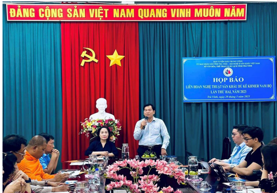
Ban Tổ chức họp báo về Liên hoan Nghệ thuật Sân khấu Dù Kê Khmer Nam Bộ lần II năm 2023.

Vừa qua, tại Trà Vinh, Hội Nghệ sĩ sân khấu Việt Nam phối hợp với Sở Văn hóa, Thể thao và Du lịch họp báo về việc tổ chức Liên hoan Nghệ thuật Sân khấu Dù Kê Khmer Nam Bộ lần thứ II năm 2023.