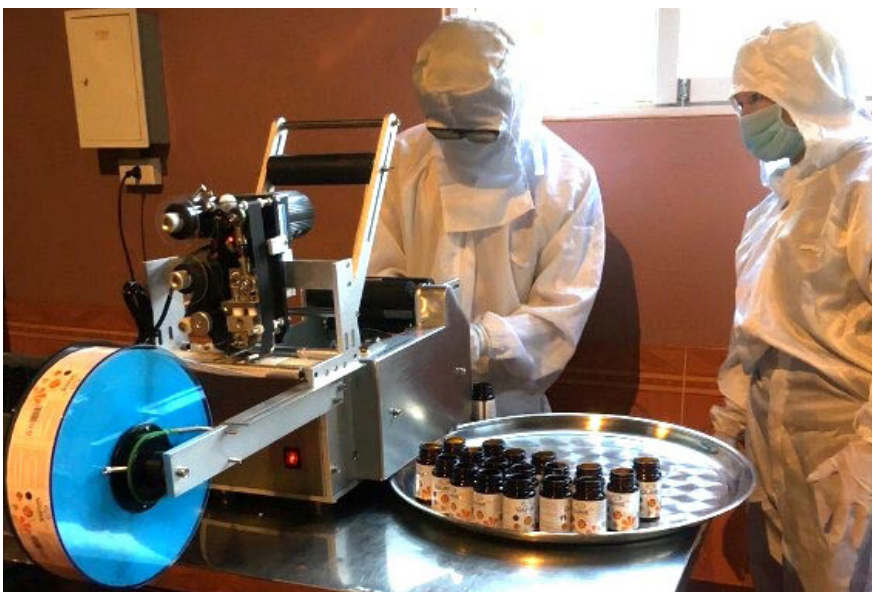
Hoạt động khuyến công Bắc Kạn đã góp phần quan trọng phát triển công nghiệp địa phương