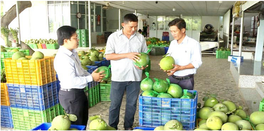
HTX cây ăn quả Tân Mỹ với sản phẩm bưởi da xanh đạt chứng nhận OCOP.