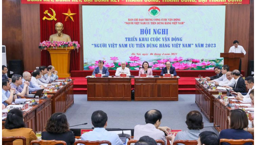
Quang cảnh Hội nghị.

Sáng 6/4, tại Hà Nội, Ban chỉ đạo Trung ương Cuộc vận động Người Việt Nam ưu tiên dùng hàng Việt Nam tổ chức Hội nghị triển khai Cuộc vận động “Người Việt Nam ưu tiên dùng hàng Việt Nam” năm 2023.