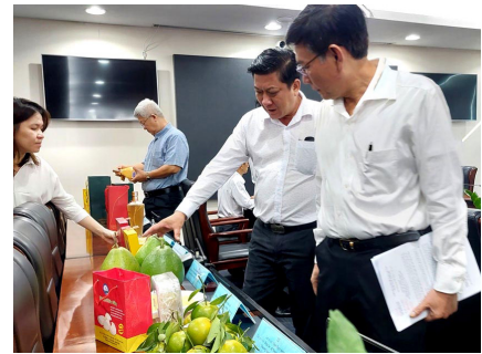
Các đại biểu tham quan sản phẩm dự thi Chương trình OCOP tỉnh