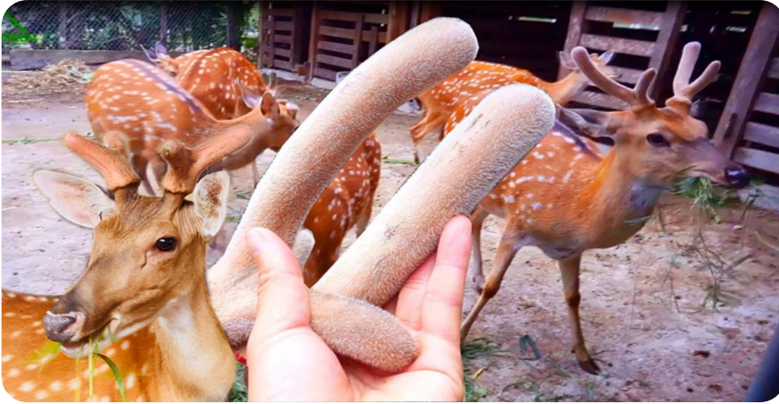
Sừng non của con hươu đực có mặt bên ngoài mềm mại và phủ lớp lông mịn như nhung nên được gọi là nhung hươu