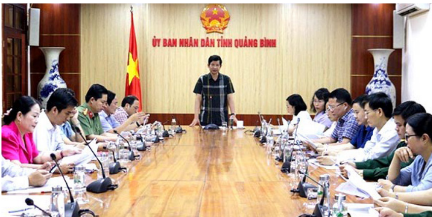
Phó Chủ tịch UBND tỉnh Hồ An Phong chủ trì cuộc họp bàn tổ chức kỷ niệm 20 năm Phong Nha - Kẻ Bàng được công nhận là di sản thiên nhiên thế giới.

Để các nghề thủ công mỹ nghệ thoát khỏi khó khăn, chinh phục được thị trường, cần có sự kết nối giữa các nghệ nhân với cộng đồng sáng tạo để đổi mới, mang hơi thở đương đại vào sản phẩm thủ công mỹ nghệ.