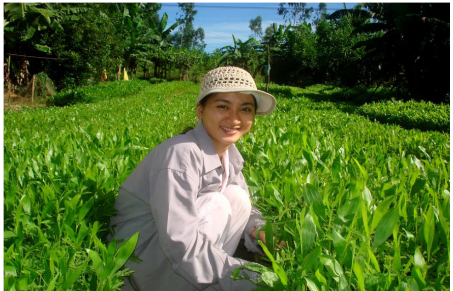
Các sinh viên cũng tham gia ươm keo lai để kiếm tiền ăn học.

T rao đổi với chúng tôi, ông Võ Sơn, Bí thư Chi bộ kiêm Trưởng thôn Hòa Hải cho hay, toàn thôn có trên 154 hộ dân với trên 550 nhân khẩu. Đa phần các hộ dân ở ngoại thành Đà Nẵng lên đây theo diện kinh tế mới từ những năm 1980. Ngày ấy, do thiếu kinh nghiệm sản xuất, thiên tai hạn hán, thú rừng phá hoại hoa màu, mùa màng thất bát, nên một số hộ đã bỏ đi nơi khác hay về quê cũ. Hiện nay, có trên 20 hộ là hội viên phụ nữ theo nghề ươm, giâm cành cây keo lai giống trên diện tích 12.300 m 2 , hằng năm sản xuất gần 3.700.000 cây, thu về với số tiền trên 1.850 tỷ đồng.