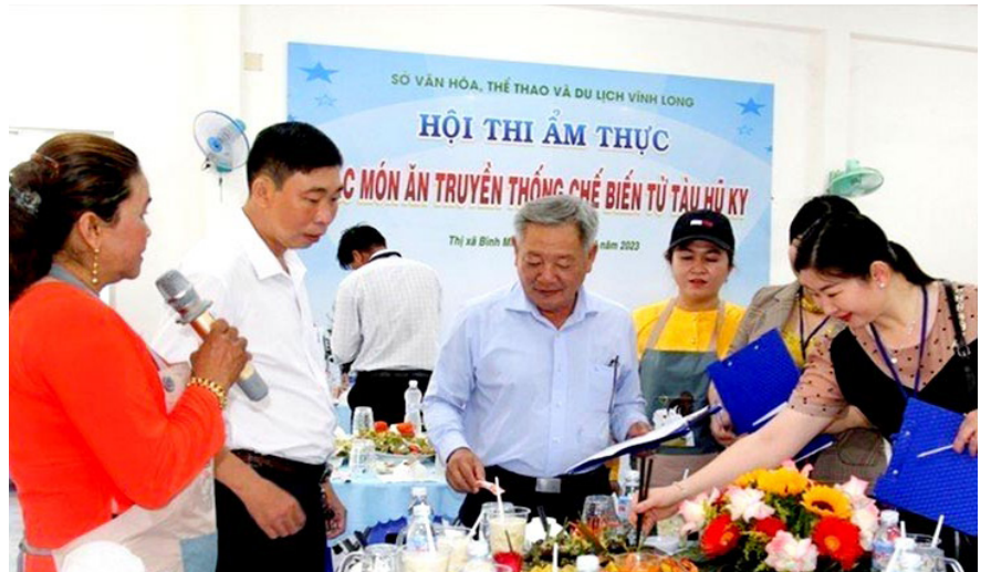
Đại diện các đội thi thuyết minh về món ăn trước Hội đồng Ban giám khảo.