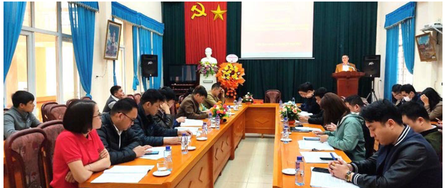
Lãnh đạo Sở Công thương chỉ đạo các nhiệm vụ trọng tâm trong công tác khuyến công năm 2023.

Các đề án khuyến công tập trung ưu tiên hỗ trợ sản xuất sản phẩm mà tỉnh có lợi thế về vùng nguyên liệu, như chế biến nông, lâm sản. Tập trung hỗ trợ cơ sở công nghiệp nông thôn (CNNT) nâng cao công nghệ sản xuất, phát triển theo hướng sản xuất hàng hóa; hỗ trợ thuê tư vấn trợ giúp cơ sở CNNT trong sản xuất, kinh doanh. Nguồn hỗ trợ kinh phí khuyến công phát huy tốt vai trò “vốn môi”, khuyến khích các cơ sở CNNT mạnh dạn đầu tư, phát triển sản xuất.